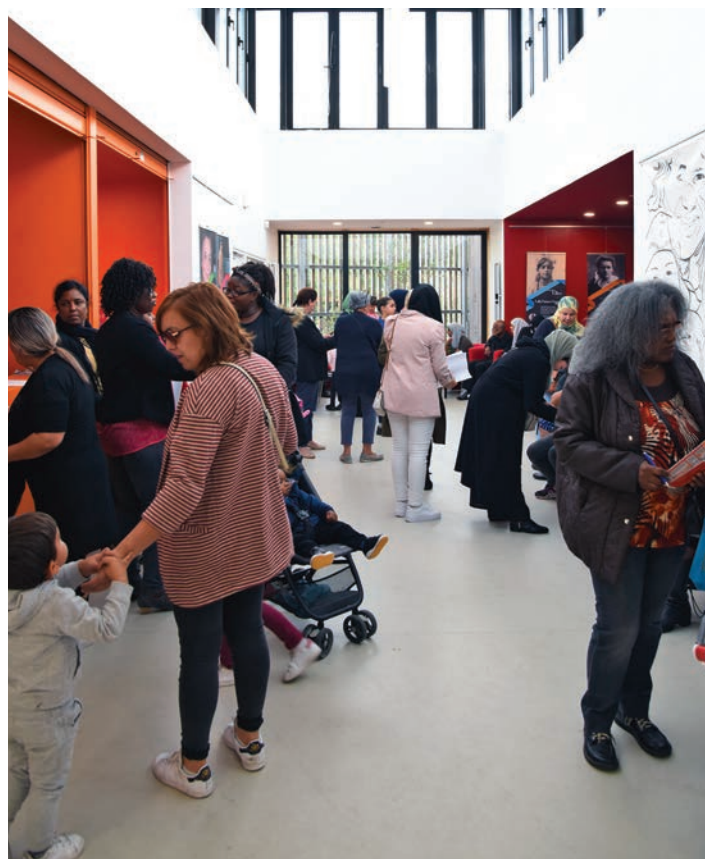
Les portes étaient grandes ouvertes pour découvrir les activités de la Maison de quartier Yamina-Setti.