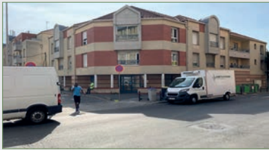
STAINS. Bel appt F4 de 77 m 2 , en centre ville de Stains, dans une résidence récente, au 1 er étg et comprenant : Entrée, gde cuis, séjour double, cellier, WC, 2 chbres dont 1 avec placard intégré, SdB. Chauff coll. Le bien est complété par une cave et box fermé. Immeuble ... 190 000 €