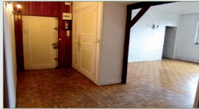
STAINS. Ds petite résid privée. APPT SH 87 m 2 . Ent av plc, wc, séjour, cuis, 3 chbres dt 1 av loggia, sdBs, buanderie. Chauff indig gaz. Cave. BOX privé 1 VL.Chgs 168 € par mois. 145 000 €