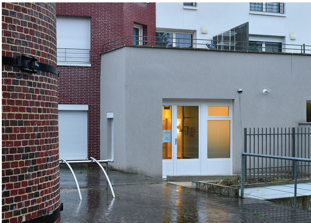
Depuis septembre, une crèche est ouverte rue de la Molette.

Mercredi 26 septembre, pour sa rentrée, le Conseil municipal a porté 19 points à l'ordre du jour. Avec la présentation d'un document attendu : le rapport de la Chambre régionale des comptes (CRC) sur la gestion de la collectivité note que « la situation financière de la commune s'améliore ». Compte rendu des débats