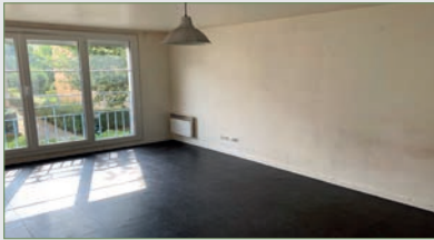
EPINAY SUR SEINE. CENTRE VILLE. APPT F4. SH 74,23 m 2 Entrée, séjour, cuisine, trois chambres, salle de bains, wc, cave. Un emplacement de parking en sous-sol. 142 000 €