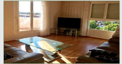
STAINS. Ds résid privée proche gare RER. APPT F3. SH 65 m 2 et terrasse 8 m 2 . TBE. Ent, cellier, wc, cuis équipée et coin repas, séjour s/terrasse, 2 ch, sdBs. PK privé 1 VL couvert. Chauffage collectif. 178 000 €