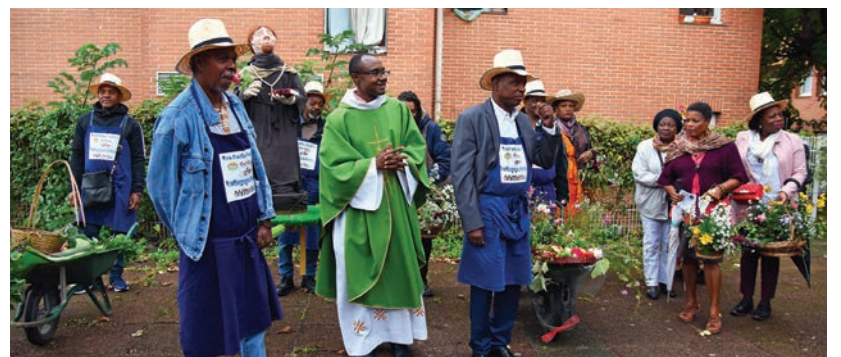
Les jardiniers stanois ont défilé et célébré leur patron : Saint-Fiacre.