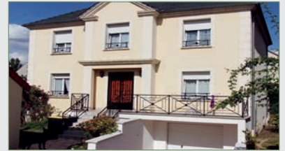
STAINS. AVENIR. PAVILLON 2001. TRÈS BELLES PREST. SH 170 m 2 s/468 m 2 ter. Ent av placd, séj dbles/terr. gde cuis. US éq, 1 ch, wc. 1 er ch parentale av bs et dche priv, 1 ch av sdE priv, 2 ch, 1 sdBs, wc. S/sol ttal Gge 4 VL, buand/chauff. C/Gaz chaudière neuve. Sols chauffants. Aspi centralisé. 485 000 €