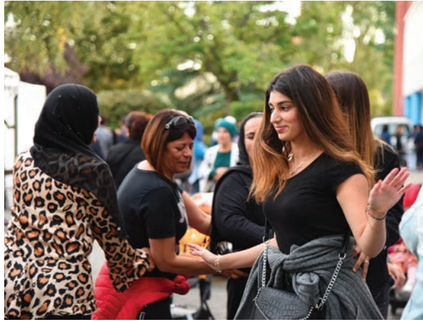
La fête multiculturelle des quartiers du Maroc et de l'Avenir a offert de jolis instants de partage.