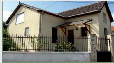
STAINS. PAVILLON INDÉPENDANT BE s/430 m 2 ter. SH 120 m 2 . Entrée, wc, séjour sur balcon et jardin, cuis., 1 chbre avec sdBs wc privative, au 1 er , palier, 1 chbre mansardée, 1 grande chbre, belle SdB avec wc. S/sol total (H 1m75) séjour et 1 chambre avec fenêtres hautes, chauffer... 344 000 €