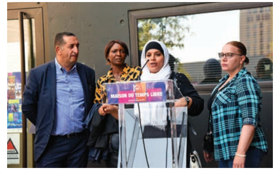
La célébration des 10 ans de la Maison du temps libre s'est déroulée entre discours et festivités.