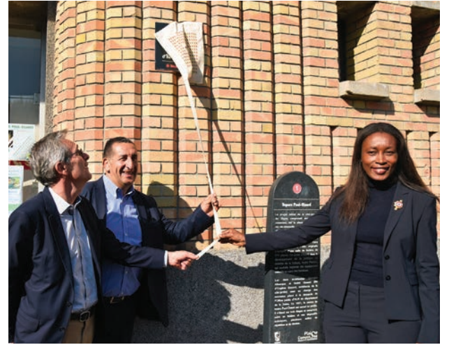
Une plaque a été dévoilée lors des Journées du patrimoine. Affichant le label de reconnaissance « Patrimoine d'intérêt régional » décerné à la Cité-jardin.