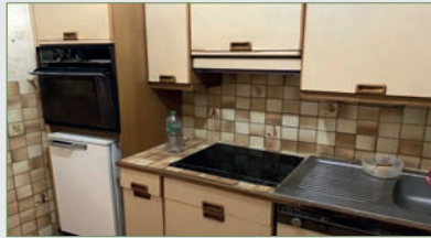
STAINS. MAISON PLAIN-PIED À RÉNOVER sur 290 m 2 ter. SH 77 m 2 . Ent, cuis, séjour, 2 chbres, un bureau, une s d'eau wc. Cave partielle. Grenier. Gge attenant pour petite voiture. Ch/GAZ 242 000 €