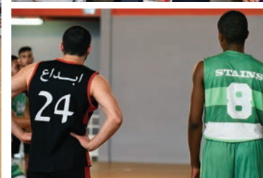
Une rencontre symbolique entre Stanois et Palestiniens à Léo-Lagrange.