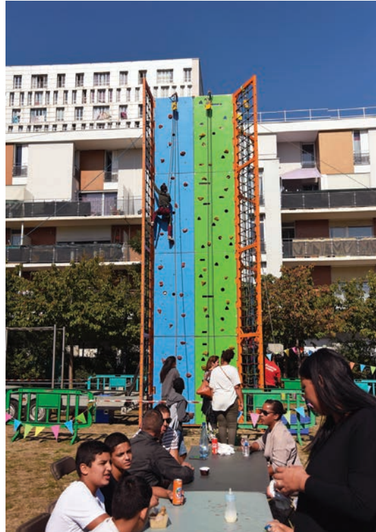
Le quartier du Clos a été fêté par ses habitants.