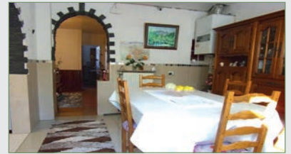
STAINS. MAISON JUMEELEE TBE sur un terr. de 193 m 2 . SH 70 m 2 . Entrée avec placard, 1 ch., salle d'eau wc/buand., salon, cuis. équipée, salle à manger sur terrasse et jardin arrière, à l'étage, 1 chbre, 1 bureau. C/Gaz. Fenêtres DV. Dépendance en fond de jardin de deux pièces wc. Pk 1 VL... 219 000 €