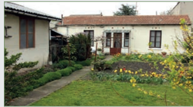
STAINS. MAISON PLAIN-PIED en fond de propriété s/312 m 2 ter. SH env 70 m 2 . Séjour et salon attenant, 1 chbre, 1 seconde chbre d'enfant contiguë, salle d'eau wc récente, chaudière, atelier, petite serre et débarras, gar. extérieur. C/Gaz. 212 000 €