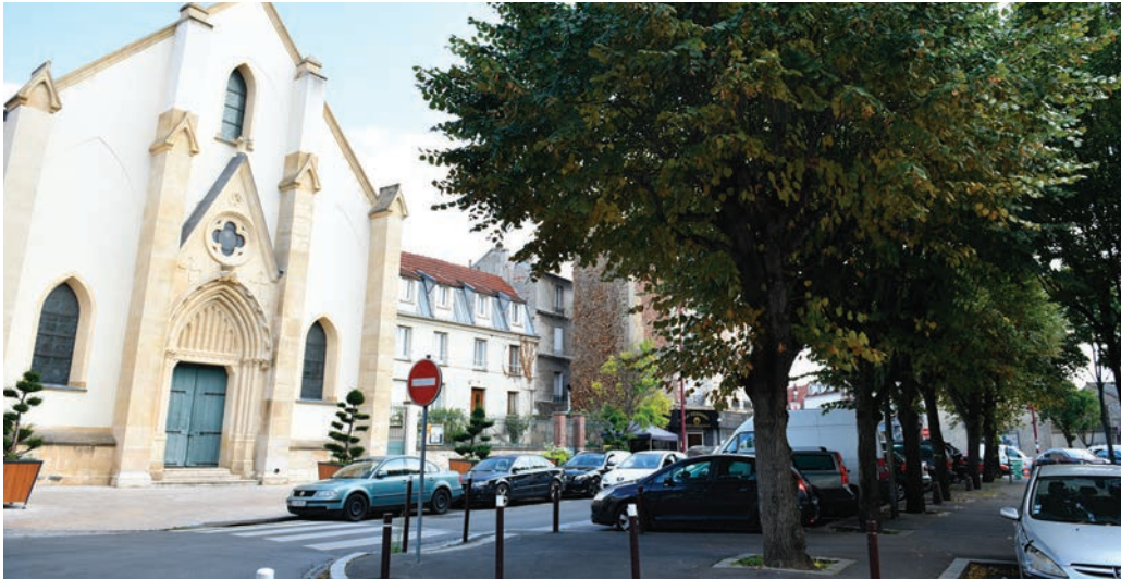
C'est sur la place Fabien qu'auront lieu les festivités.

Dix ans que cette Maison du droit et de la médiation (MDM) accueille les Stanois pour les accompagner dans l'exercice de leurs droits ! Vendredi 16 et samedi 17 octobre, la population est invitée aux festivités pour célébrer cet anniversaire.