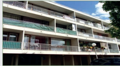
STAINS. Dans résidence privée, APPT F4. SH 70 m 2 . Entrée, séjour, cuisine, trois chambres, balcon, salle de bains, wc. Cave. Emplacement parking extérieur privé. 148 000 €