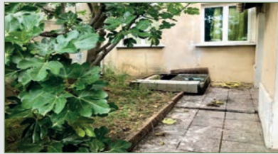
PIERREFITTE/SEINE. MAISON s/166 m 2 . Proche tramway. SH 70 m 2 . Entrée, séjour, cuisine, trois chambres, salle de bains wc. Chauffage électrique. 203 000 €