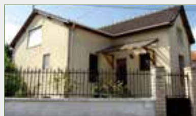
PIERREFITTE. Pav. indé. BE s/430 m 2 ter. SH 120 m 2 . Ent., wc, séj./balcon et jar., cuis., ch. + sdb wc privative, 1 er ét. : ch. mansar., grd ch., b. sdb + wc. S/sol total (H 1,75 m), séj., ch. + fenêtres hautes, chauffer...