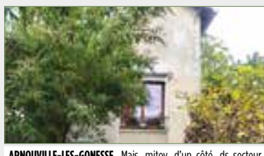
ARNOUVILLE-LES-GONESSE. Mais. mitoy. d'un côté, ds secteur calme recherché. Près écoles prim. et mater. À 15' gare d'Arnouville, Villiers-le-Bel, Gonesse (RER D), du centre-ville, maison composée ainsi : séjour lumineux. À voir.