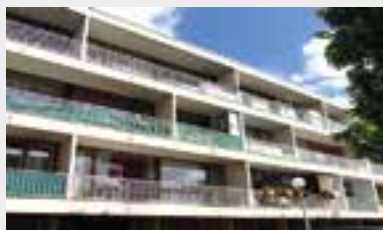
STAINS. Dans résidence privée, F4. SH 70 m 2 . Entrée, séjour, cuisine, trois chambres, balcon, salle de bains, wc. Cave. Emplacement parking extérieur privé.