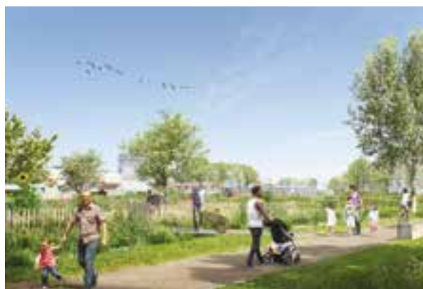
© Atelier Jours – La Graine

Mardi 10 décembre, à 18h30, la réunion publique programmée à la Maison du temps libre présentera les futurs espaces publics aménagés dans la partie stanoise des Tartres sud. Une composante essentielle de l'écoquartier des Tartres. Les techniciens de Plaine commune en charge de ce dossier et l'urbaniste de la ville dévoileront chiffres, dates, graphiques et plans du cœur vert. Appelé « Plaine Est », ce parc se compose d'un petit bois, d'un grand verger et de trois parcelles agricoles destinées à l'agriculture urbaine. S'y ajoutent l'aménagement d'une nouvelle rue, de placettes, de promenades et de chemins favorisant la circulation des cyclistes et des piétons. De même, la rue d'Amien sera complètement réaménagée pour créer une piste cyclable et des trottoirs confortables