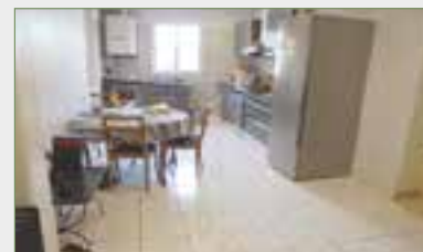
PIERREFITTE-SUR-SEINE. Ds petit immeuble F5. SH 95,17 m 2 . Entrée, salle à manger, cuisine US, séjour avec placards, 3 chambres, salle de bains, wc. Chauffage individuel au gaz. Faibles charges.