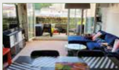
STAINS. Ds imm. 2016. F4. SH 81,33 m 2 . 1 er ét. asc. Ent., plac., séj./balcon, cuis. US équ., ch. parent. + sde priva. + lavabo, 2 ch., wc, sdb + wc. Emplacement de parking privé. Chauff. collectif. Compteurs.