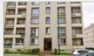
GARGES-LÈS-GONESSE. F3, 63,6 m 2 , avec balcon. Près gare et commerces, écoles et transports. Ent., séj., cuis. aménagée-équipée, dégag., 2 ch., sdb, wc séparé. Cave et place de parking.