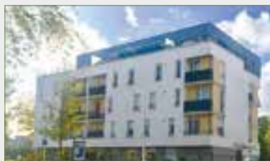
GARGES-LÈS-GONESSE. Ds résid. réc. et sécu. F2 de 42 m 2 . Entrée, séj. lumi., coin cuis., ch. spac., sdb + wc. Places de parking en sous-sol sécurisé. Idéal investisseur ou premier achat.