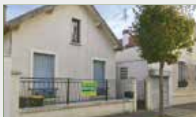
STAINS. Maison plain-pied. À rénover sur 290 m 2 ter. SH 77 m 2 . Ent., cuis., séjour, 2 ch., bureau, sde, wc. Cave partielle. Grenier. Garage attenant pour petite voiture. Chauff. gaz.