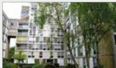
STAINS. Proche Flanade. Ds résid. rech. et sécu., 4 p. de confort (tt inclus ds char.), ent., cuis. spac., séj., s. à man.(ou 3 e ch.)/ sur loggia, dégagement, 2 chambres, salle de bains et wc sép.