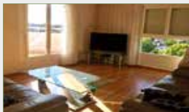
STAINS. Ds résidence privée proche gare RER. F3. SH 65 m 2 + terrasse 8 m 2 . TBE. Entrée, cellier, wc, cuis. équipée + coin repas, séjour s/terrasse, 2 ch., sdb. PK privé 1 VL couvert. Chauff. collectif.