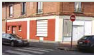
GARGES-LÈS-GONESSE. Dans le quartier Lutèce, local comm. 106 m 2 , boutique, magasin, 3 salles, sanitaires. Isolation phonique. Chauff. ind. élec. Pas de park. ni possibilité. Charges 80 €/mois, eau froide comprise.