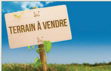
STAINS. Dans le quartier de l'Avenir, surface de 460 m 2 , constructible avec façade de 16,70 m, maison à démolir. 244 000 €