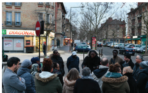
Visite de terrain dans le secteur Centre.