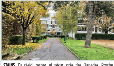
STAINS. Ds résid. recher. et sécu. près des Flanades. Proche gare RER D de Pierrefitte/Stains. Spacieux 5 pièces idéalement agencées, entrée ouverte, dressing, double séjour lumineux avec loggia fermée. 212 000 €