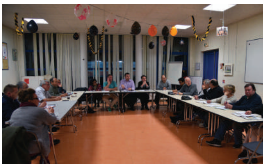
Réunion plénière au secteur Nord.