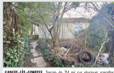
GARGES-LÈS-GONESSE. Terrain de 714 m 2 sur plusieurs parcelles avec maison de type F3 à rénover. Possibilité de construction avec 16 mètres de façade. Terrain viabilisé. 350 000 €