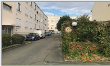
STAINS. Beau F3 (rue Jean Durand) ds résid. priv. et sécu. cons. 1956. Ent. ouv., cuis. spac. + chaudière à écono. d'éner. neuve, séjour, dégagement, 2 chambres, salle d'eau et wc séparé. 137 000 €