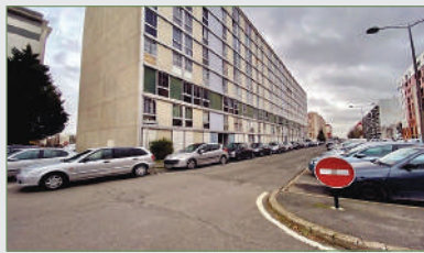
GARGES-LÈS-GONESSE. Grand F2, 46 m 2 , situé proche mairie et transports. Entrée, cuisine, séjour, chambre, salle de bains, wc, rangements. Idéal investisseur ou primo-accédant. 120 000 €