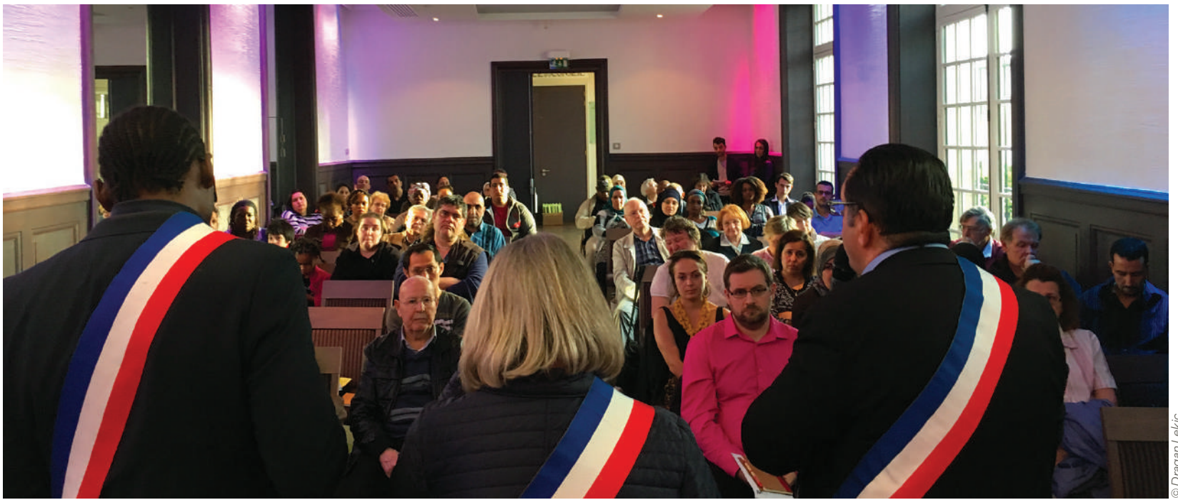
Lancement des Conseils d'Habitants en mairie le 30 mars 2017

Le 28 février, à partir de 20h en mairie, se tiendra une assemblée générale des Conseils d'habitants. Le but de cette soirée: recenser les actions qui fonctionnent et envisager de nouvelles perspectives pour cette année.