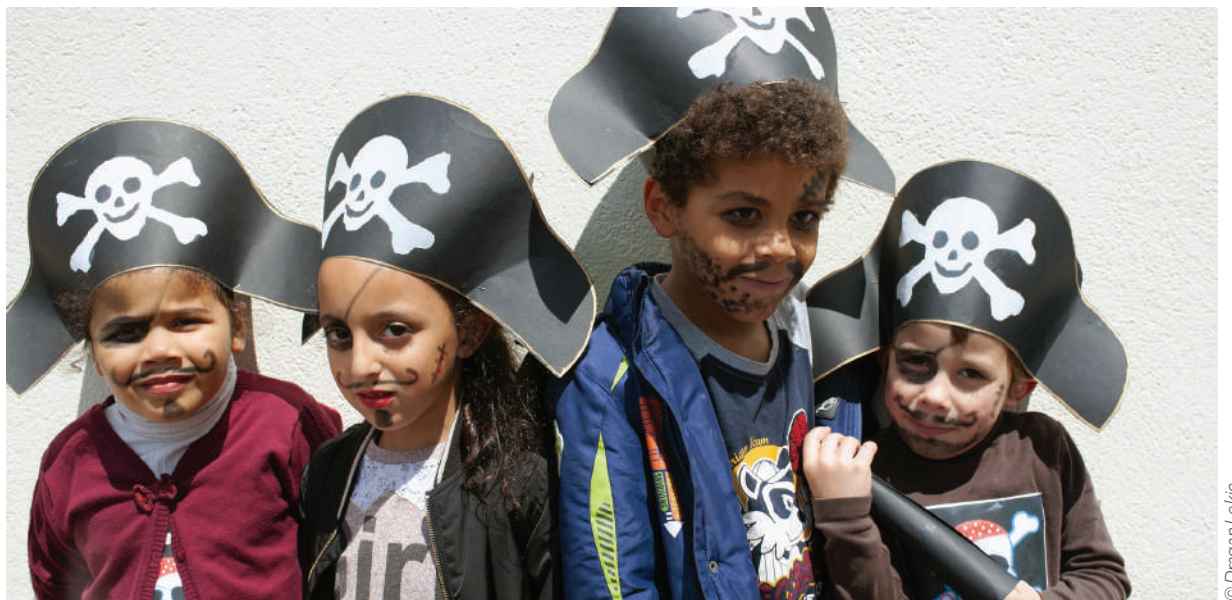
Une chasse au trésor à été organisée le 8 juin dernier à Louis Bordes grâce au FPH.

Objectif : utiliser ces expériences pour susciter de nouvelles idées.