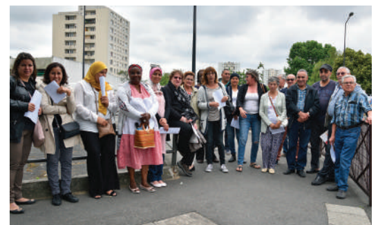
Repérage des dysfonctionnements dans le secteur Sud.