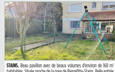
STAINS. Beau pavillon avec de beaux volumes d'environ de 160 m 2 habitables. Située proche de la gare de Pierrefitte-Stains. Belle entrée avec rangement sur mesure, cuisine d'été, véranda. Étage : palier dessert un grand séjour, belle cuisine équipée et aménagée, grande... 385 000 €