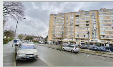
GARGES-LÈS-GONESSE. Ds quartier du Plein Midi, 2 e ét., imm. 9 ét., F4, 70 m 2 , entrée + placard, cuisine avec balcon, séjour dominant sur loggia, 3 chambres, salle de bains, wc, cave. 139 000 €