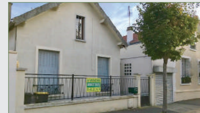
STAINS. Maison plain-pied. À rénover sur 290 m 2 ter. SH 77 m 2 . Ent., cuis., séjour, 2 ch., bureau, sde, wc. Cave partielle. Grenier. Garage attenant pour petite voiture. Chauff. gaz. 242 000 €