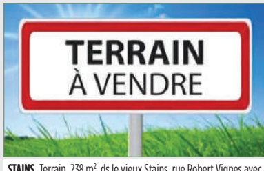
STAINS. Terrain, 238 m 2 , ds le vieux Stains, rue Robert Vignes avec projet d'imm. de 5 log. accordés., surf. autorisée par la mairie : 270 m 2 . Empla. de park. Plan et autorisation visible en agence. 245 000 €