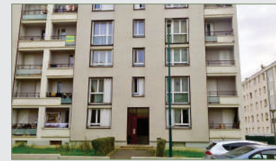
GARGES-LÈS-GONESSE. F3, 63,6 m 2 , avec balcon. Près gare et commerces, écoles et transports. Ent., séj., cuis. aménagée-équipée, dégag., 2 ch., sdb, wc séparé. Cave et place de parking. 160 000 €