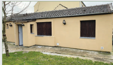
STAINS. Maison, F3, 50 m 2 environ de plain-pied. Entrée, cuisine, séjour, 2 chambres. Aucun travaux à prévoir. Idéal investisseur ou primo-accédant. 220 000 €