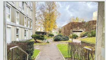
STAINS. Proche Flanade. Ds résid. recher. et sécuri. B. 4 p. de confort (tt inclus ds les charges), entr., cuis. spac., séj., s. à manger (ou 3 e ch.), donnant sur loggia, dégagement, 2 chambres... 172 000 €