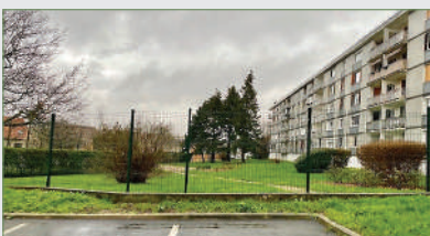
GARGES-LÈS-GONESSE. Appt de 92 m 2 , proches mairie, écoles et commerces et gare à 5' à pied. Ent., grd séj. lumineux donnant sur son balcon, cuisine séparée et meublée, couloir dessert 3 belles chambres, salle de bain récente, wc séparé. Nombreux rang... 179 000 €