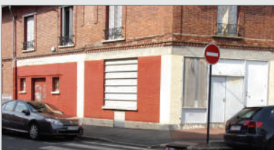
GARGES-LÈS-GONESSE. Dans le quartier Lutèce, local comm. 106 m 2 , boutique, magasin, 3 salles, sanitaires. Isolation phonique. Chauff. indi. élec. Pas de park. ni possibilité. Charges 80 €/mois, eau froide comprise. 210 000 €