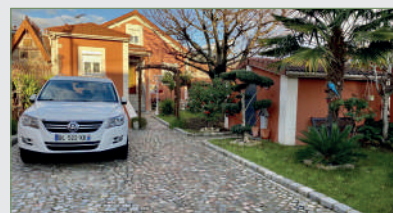
STAINS. Pavillon en excellent état ds sect. recherché de l'Avenir. Entrée, grande cuisine, grand double séjour, sdb. Étage ch., ch. d'enfant ou bureau. Au rez-de-jardin se trouve une partie indépendante 335 000 €