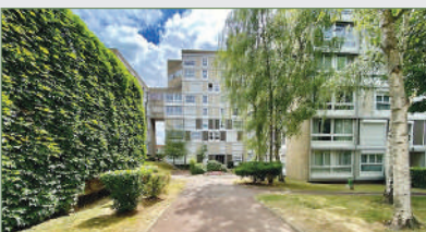
STAINS. Ds résid. recher. près gare de Pierrefitte-sur-Seine. Appt 100 m 2 , ent., cuis. sép., dble séj., 3 ch., sdb, 2 celliers. 2 places de parking intérieur ainsi que 3 places de parking extérieur... 212 000 €