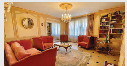
STAINS. Beau 4 pièces soigné, entrée, double-séjour, cuisine séparée, 2 grandes chambres. Beau balcon qui longe tout l'appartement. Parking extérieur, cave. 195 000 €