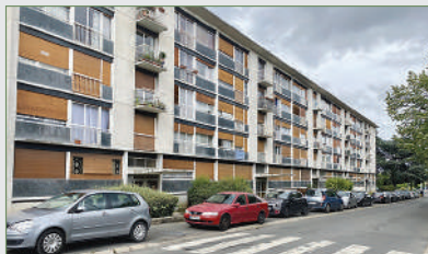
SARCELLES. F4 au centre proche Flanades. À proximité des transports et des commerces, entrée, séjour, cuisine, 3 chambres, salle de bains, WC, cave. 150 000 €