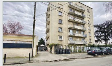
PIERREFITTE. F3, 62 m 2 au pied du tramway et proche centre-ville de Pierrefitte. Entrée, cuisine, beau séjour donnant sur balcon, 2 chambres, salle de bain, WC séparé. A rafraîchir. 159 000 €