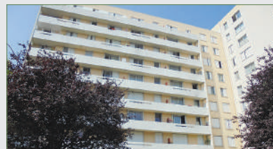
STAINS. F4 de 75 m 2 proche Carrefour Globe. Entrée, séjour, cuisine, 3 chambres, salle de bains, cellier, WC, cave. Aucun travaux à prévoir. Exclusivité Immostains !!! 193 000 €