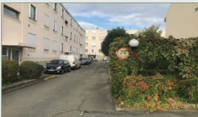
STAINS. Beau F3 (rue Jean Durand) ds résid. priv. et sécu. cons. 1956. Ent. ouv., cuis. spac. + chaudière à écono. d'éner. neuve, séjour, dégagement, 2 chambres, salle d'eau et wc séparé. 147 000 €