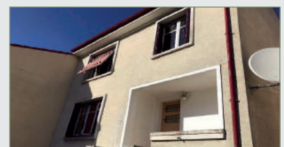
GARGES-LÈS-GONESSE. Pavillon quartier de la Lutèce proche transports sur parcelle de 391 m 2 . Entrée, WC, double séjour, cuisine. À l'étage, 3 ch. et sdb. Possibilité de créer un studio d'environ 30 m 2 . Grand garage. 375 000 €