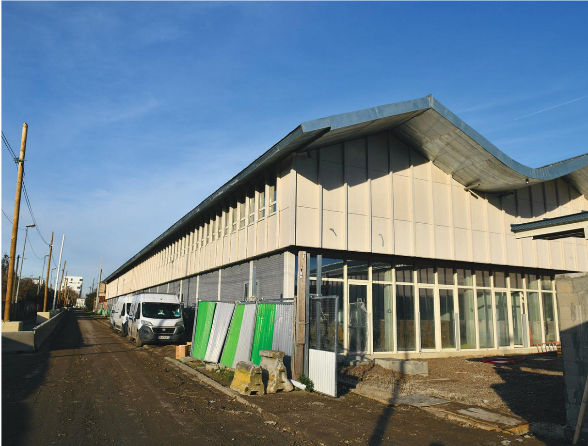
Le groupe scolaire Lucie-Aubrac, accueillera les écoliers dès la rentrée 2021-2022.