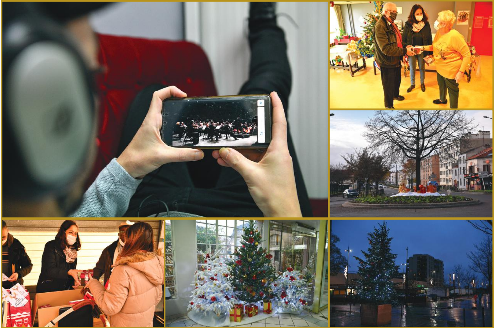
Festival Classiq' à Stains en ligne, décorations de Noël, distributions de chocolat,...