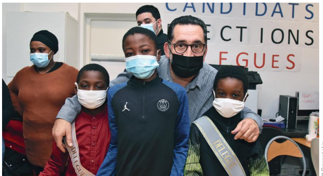
Le maire a assisté au dépouillement des bulletins et à l'annonce des résultats.

Éducation, culture, loisirs et accompagnements divers et variés aussi bien pour les jeunes que les adultes... l'APCIS, une association ouverte à tous. Reportage.