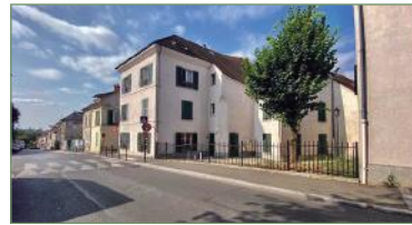
SARCELLES. Au cœur du village de Sarcelles, beau duplex spacieux. Avec entrée, cuisine ouverte sur le séjour, chambre, wc, salle d'eau. Au 1 er étage : 3 chambres, salle de bains avec WC. Charges faibles.