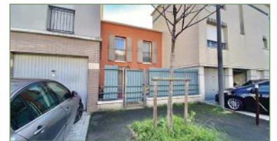
STAINS. Dans résidence de standing de 2008, duplex totalement indépendant, avec entrée, séjour avec cuisine ouverte aménagée donnant sur belle terrasse de 20 m 2 , WC. À l'étage : dégagement, 2 chambres, salle de bains, WC. Box. Charges faibles. Aucun travaux à prévoir.