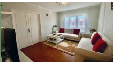
GARGES-LES-GONNESSE. Beau et grand F4 de 75m 2 . Composé d'une entrée, séjour, cuisine équipée, 3 belles chambres, salle de bains. Aucun travaux à prévoir. Charges faibles. Travaux de ravalement voté et payés.