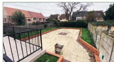
GARGES LES GONNESSE. Quartier Lutèce, maison sur 500m 2 de terrain, un RdC avec grande entrée, cuis. équipée de 18 m 2 , séjour double de 45m 2 avec chem. à foyer fermé, 3 ch., une SdB avec baignoire et douche, 2 WC séparés. À l'étage, palier avec possibilité bureau, combles aménagés sans fenêtres, 2 ch. de 15m 2 env. et 50m 2 une SdB et un WC séparé. Sous-sol total, garage double et portes électrifiées, cave, WC, cuisine d'été et salle de jeux. 530 000 €