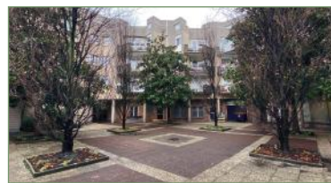
PIERREFITTE-SUR-SEINE. Dans copropriété calme et sécurisée, 2 ème étage avec ascenseur, gd F3 avec entrée, cuisine et coin repas, séjour avec terr. donnant sur espaces verts. Une partie nuit, dégagement avec placard, 2 chbr avec rangement et SdB, WC séparés, cellier commun à l'étage, place de parking en S.S. Prévoir des travaux de rafraîchissements. 169 000 €