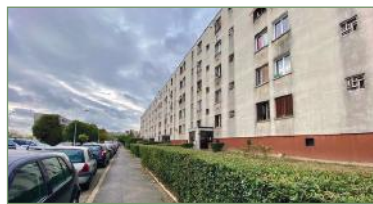
GARGES-LES-GONNESSE. Appartement de type F3 de 53 m 2 . Composé d'une entrée, cuisine, salon, 2 chambres, salle de bains, WC. Beau balcon, cave. Faibles charges et en bon état.