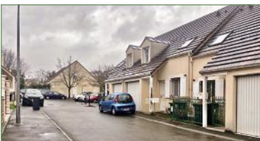
PIERREFITTE-SUR-SEINE. Beau pavillon loué dans secteur pavillonnaire proche Mairie. Avec : entrée, cuisine équipée, séjour, nombreux rangements, WC. À l'étage : 3 chambres, salle de bains, WC. Petit jardin et garage.