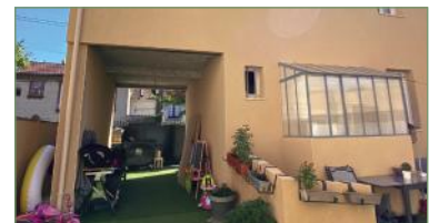
PIERREFITTE-SUR-SEINE. Secteur de l'avenir, idéal invest. locatif ou pour gde famille, sur un terr. d'env. 320 m 2 . 3 maisons, 1 à l'avant du terrain sur rue et à l'arrière, 2 maisons identiques, avec RDC, séjour et cuis. ouverte, au 1 er et 2 ch. , salle d'eau WC, au 2 ème ét., 2 ch. enf., salle d'eau WC, sous-sol total. Avec terr. fermées et jardinets. Maison à l'avant à une gde cuis. ouverte avec salle à manger, un séjour, 3 ch., salle d'eau avec WC. Produit rare. 850 000 €