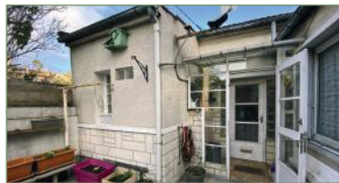
SAINT-DENIS. Beau plain pied dans un secteur pavillonnaire avec entrée, cuisine équipée et récente, séjour, chambre, bureau, salle d'eau, WC. Petite cour à l'avant de la maison.