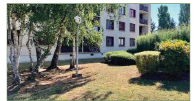
GARGES LES GONNESSE. Dans résidence recherchée, bel appartement spacieux de 93 m 2 . Proche de toutes commodités (maternelle, primaire, lycée, supermarché...). Entrée, cuisine, grand séjour traversant et lumineux, 2 chambres, salle de bains et WC séparés, cave.