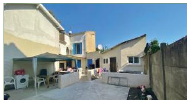
GARGES-LES-GONNESSE. Proche commodités. Maison de rapport avec 4 logements totalement indépendants, situé dans la zone pavillonnaire de la Lutèce. Idéal investisseur ou grande famille. Compteur individuel pour chaque appartement. Belle rentabilité à l'année de 36k€/an. Parcelle de 257m 2 .