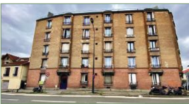
STAINS. Appartement deux pièces de 45 m 2 , avec 1 chambre, 1 salle de bains et wc. Cuisine séparée. Chauffage gaz individuel.