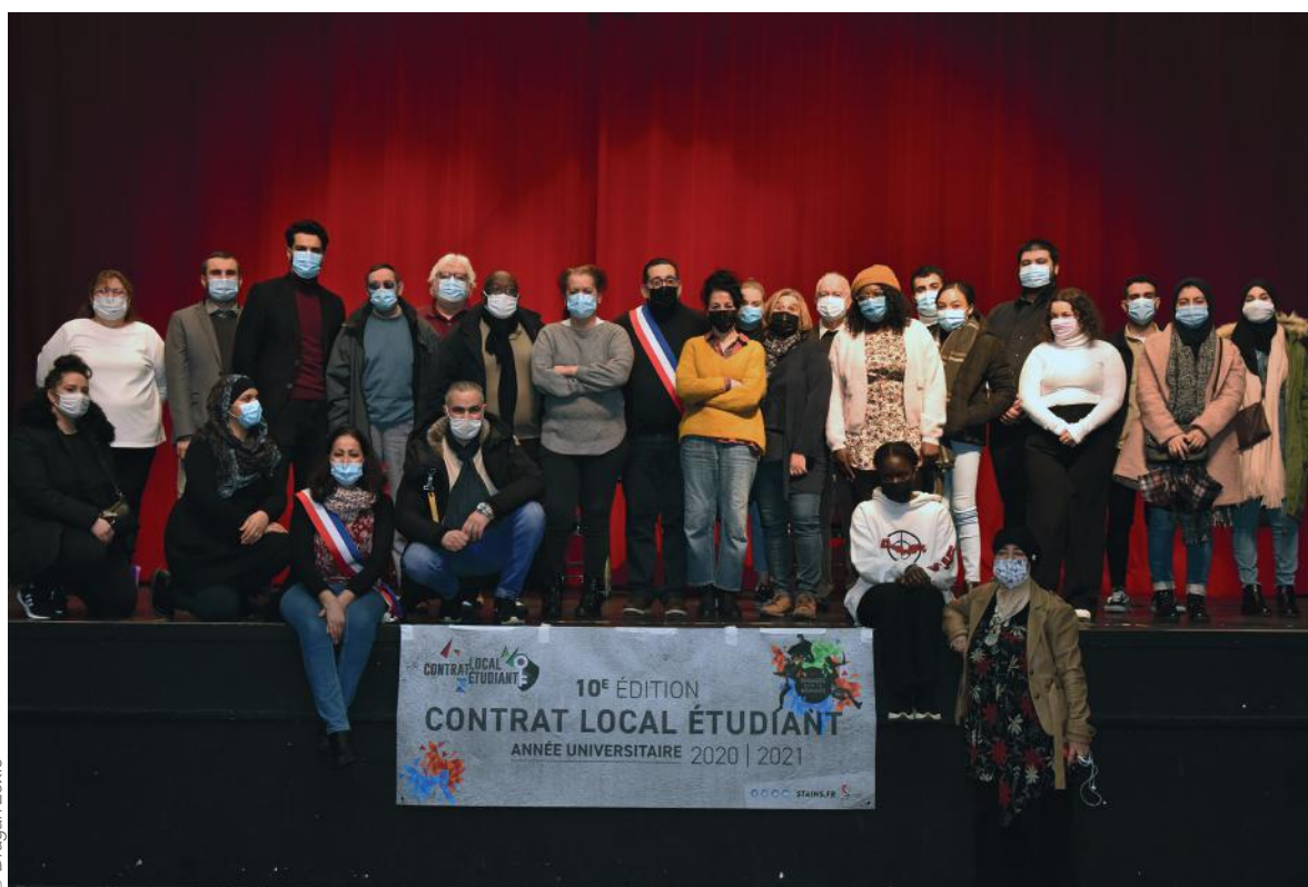
La municipalité, les associations et les étudiants ont signé la convention de la 10 e édition du CLE.

Samedi dernier, à l'Espace Paul-Éluard, une soixantaine de jeunes et 23 associations ont paraphé le nouveau Contrat local étudiant.