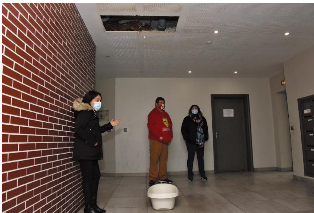
Les habitants installent des bassines dans leurs halls pour éviter les inondations.