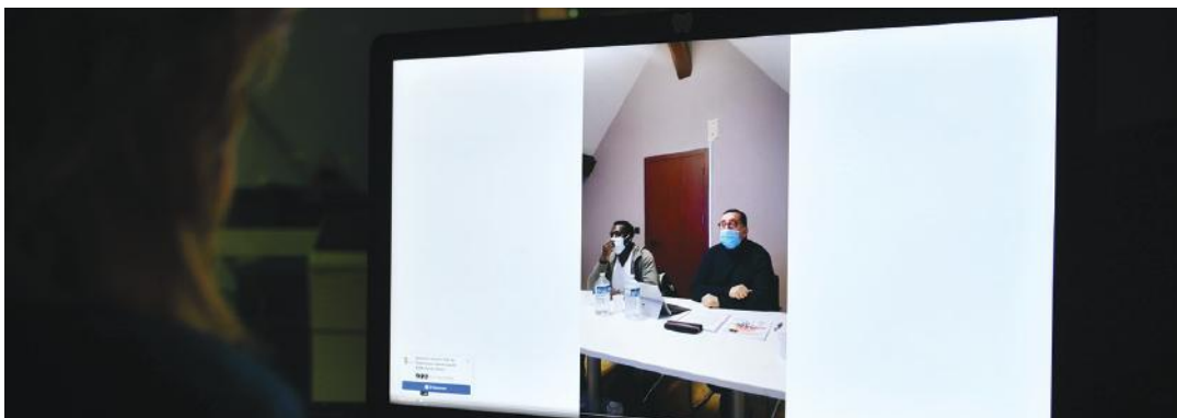
Diffusée en direct sur plusieurs plateformes, la vidéo est toujours disponible sur la page Facebook de la ville.

Une nouvelle table ronde autour de la lutte contre les violences s'est tenue mardi 16 février en présence du maire qui a réaffirmé l'engagement de la municipalité en faveur du vivre ensemble.