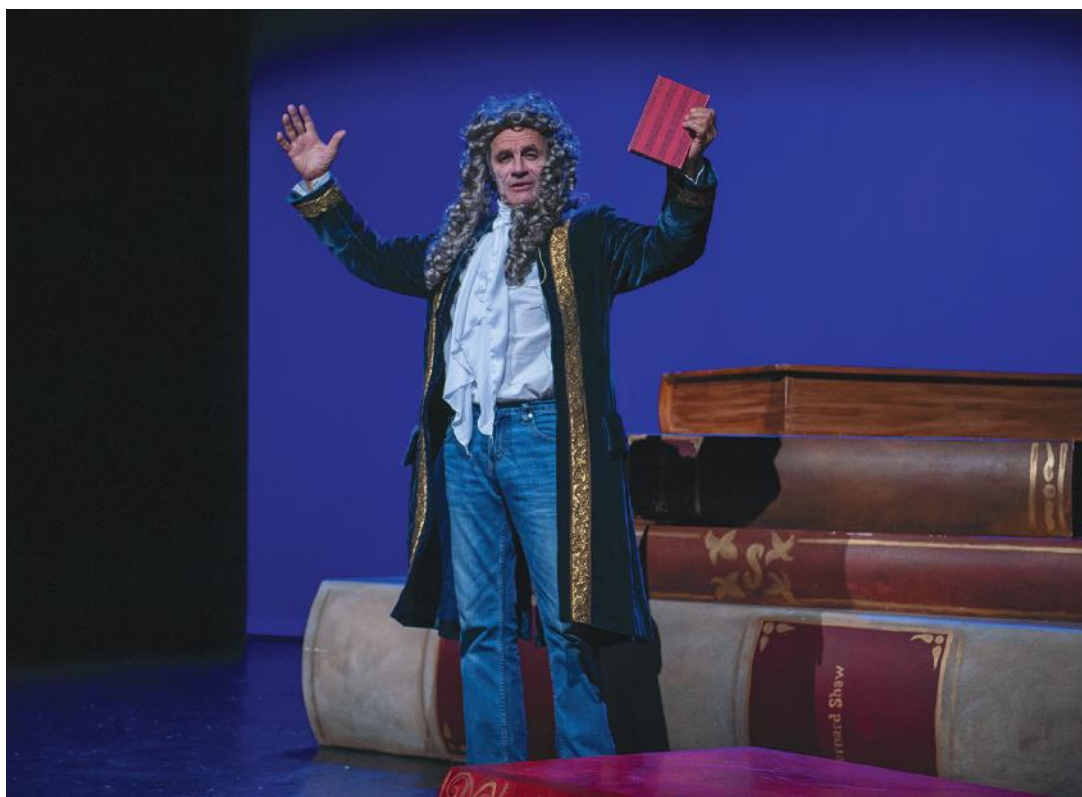
Le STS se prépare à rejouer Fables hors-les-murs partout en ville.

Bien que le public ne puisse toujours pas se rendre au théâtre, le STS met toute son énergie et son inventivité pour permettre aux Stanois de profiter de propositions artistiques.