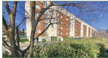
GARGES-LÈS-GONESSES. Grand F4 proche gare de GARGES-LÈS-GONESSE. Composé ainsi: Entrée, double-séjour, cuisine, 2 belles chambres, salle de bains. Une cave complète ce bien. Charges faibles... - 162 000 €