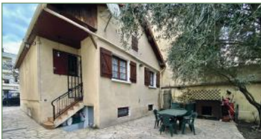
STAINS. beau plain pied proche CARREFOUR et de la future station de métro ainsi qu'une station de tramway de la gare La Courneuve - Six Routes. Composé ainsi: Entrée, cuisine ouverte sur séjour lumineux, 2 belles chambres, salle de bains, WC. Au Rez de jardin un studio indépendant avec chambre, cuisine, salle d'eau avec WC. Parcelle de 296m2. Beau potentiel!! Garage. Combles pour rangements. 294 000 €