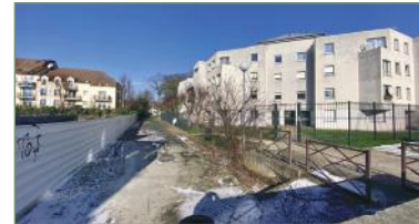
SARCELLES. Beau F3 en plein cœur de SARCELLES Village. Composé ainsi: Entrée, cuisine séparée, séjour lumineux, 2 ch., dressing, salle de bains, WC. Beau balcon. Proche toutes commodités (école, commerces) et à 10 min à pied de la gare de Sarcelle - St Brice (ligne H direction gare du nord) Charges faibles. Diagnostics de performance énergétique - 207 000 €