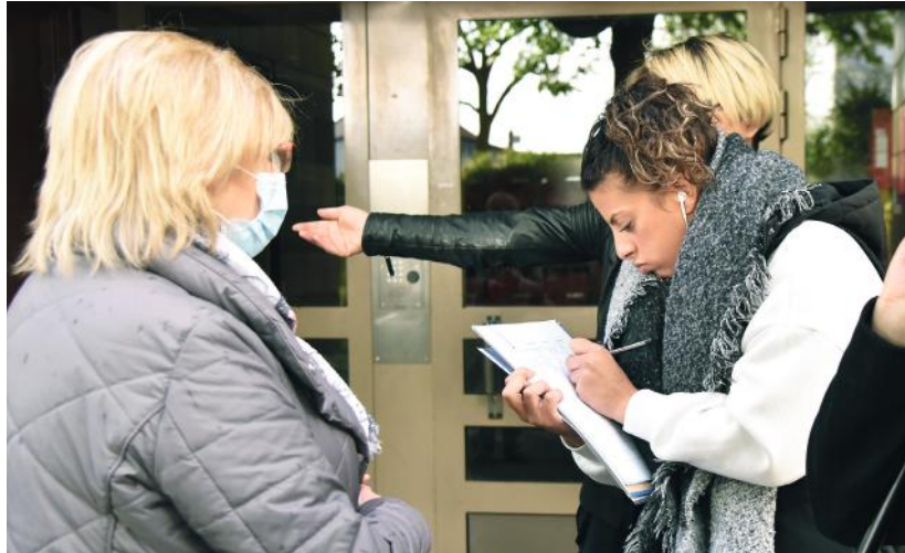
Chaque soir, l'Amicale fait du porte-à-porte afin de faire signer la pétition.

L'Amicale des locataires de la cité du Paradis ont invité Stains actu à venir constater leurs conditions de vie et pour crier leur ras-le-bol de nuisances diverses qu'ils disent subir. Reportage.