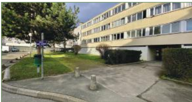
STAINS. Beau F4 dans résidence recherchée BOIS DE L'AUNAY proche transports. Composé ainsi: Entrée, séjour, cuisine séparée, 3 chambres, salle de bains, WC. Plusieurs rangements, appartement lumineux. - 189 000 €