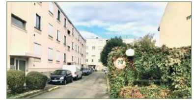
STAINS. beau F4 (Rue Jean Durand) dans une résidence privée et sécurisée construit en 1956. Situé au dernier étage, composé ainsi: Une entrée ouverte, cuisine spacieuse, séjour lumineux, dégagement, 3 chambres, salle d'eau et WC séparé, loggia fermée. Vous disposez d'un box fermé et sécurisé ainsi qu'une cave. Faible charges - 180 000 €