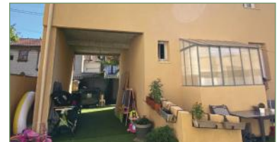
STAINS. Secteur de l'avenir, idéal invest. locatif ou pour gde famille, sur un terr. d'env. 320 m2. 3 maisons, 1 à l'avant du terrain sur rue et à l'arrière, 2 maisons identiques, avec RDC, séjour et cuis. ouverte, au 1er ét. 2 ch., salle d'eau WC, au 2e ét., 2 ch. enf, salle d'eau WC, sous-sol total. Avec terr. fermées et jardins. Maison à l'avant a une gde cuis. ouverte avec salle à manger, un séjour, 3 ch., salle d'eau avec WC. Produit rare. - 850 000 €