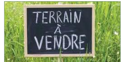
PIERREFITTE-SUR-SEINE. Beau terrain de 230m2 constructible. 5 Boxes sur la parcelle à détruire. A 15 Min à pied de la gare de PIERREFITTE. - 210 000 €