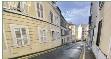
MONTMORENCY. Magnifique duplex d'une superficie de 73m2. Composé ainsi: Grand séjour lumineux sur cuisine ouverte, chambre parentale avec sa salle de bains. Plusieurs rangements. A l'étage un palier dessert une chambre avec rangement. Charges faibles. Une visite s'impose!! - 310 000 €