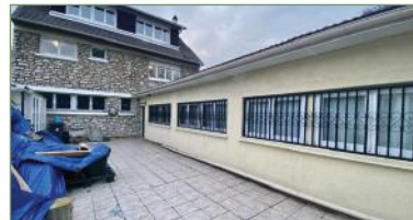
STAINS. Grd pavillon propre et lumineux avec 2 dépendances dans le secteur recherché de L'AVENIR. Grd Pav. d'environ 150 m2 habitables sans AUCUN travaux. Composé ainsi: Entrée, double séj., cuis. équipée, chb., WC, sdb. A l'étage: 3 belles chbs spacieuses avec rangement, sdb. Sur la parcelle possibilité de garer plusieurs véhicules intérieurs ou en extérieur. 1er dépendance de 90m2 loué 950€, 2e dépendance d'environ 70m2 loué 750€. Rentabilité TOTAL: 1700€ AUCUN TRAVAUX A PRÉVOIR! - 680 000 €