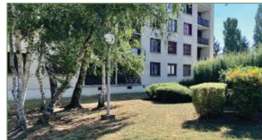
GARGES-LÈS-GONESSES. Superbe appartement Résidence LAPINSONNE. Appartement spacieux et lumineux de 92m2 au dernier étage. Une belle entrée, cuisine récente indépendante, double séjour spacieux et lumineux donnant sur un beau balcon, 3 belles chambres avec placards, salle de bains, dressing... Volets électriques et double vitrage. AUCUN travaux à prévoir, une cave ainsi qu'un box et une place de parking complète ce bien - 210 000 €