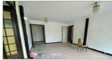
GARGES-LÈS-GONESSES. Très beau F3 refait complètement à neuf dans la résidence recherchée du CLOS L'ÉPINE. Entrée, grand séjour, 2 belles chambres, cuisine, salle de bains, WC. Cave et place de parking. - 175 000 €