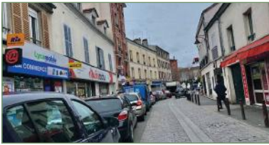
STAINS. proche Mairie beau F3 de 54m2 de surface totale. Composé ainsi: Entrée, séjour, cuisine, 2 chambres, salle de bains, WC. Cave - 160 000 €