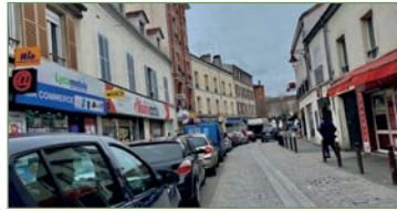
STAINS. En plein centre ville, proche des commerces et des transports, au 3 e et dernier étage, joli F2 (32 m²) très propre, dans un immeuble ancien, composé, d'une entrée, un séjour, une cuisine séparée aménagée, une salle d'eau, un WC séparé. FAIBLES CHARGES. - 130 000 €