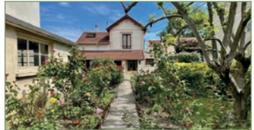
STAINS. Coup de cœur assuré pour cette maison 80 m² secteur Avenir sur une parcelle de 456m². Composé ainsi: Entrée, wc avec lave mains, buanderie, grand séjour lumineux, cuisine équipée séparée. - 1 er : 2 chambres, débarras, salle de bains avec douche et baignoire, WC. Garage et une cave complète ce bien. Un bien à visiter sans plus attendre !! sans plus attendre !! - 292 000 €