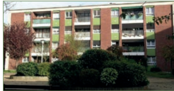
GARGES-LES-GONESSE. Appartement 77 m² - Très beau F3 refait complètement à neuf dans la résidence recherchée du CLOS L'ÉPINE. Entrée, grand séjour, 2 belles chambres, cuisine, salle de bains, WC. Cave et place de parking. - 175 000 €