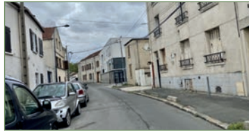
STAINS. IMMOSTAINS vous propose un produit d'investissement. Rez de jardin 35 m². Beau et grand F2 en rez de jardin, proche de la Mairie de STAINS. Entrée, salon, chambre, salle d'eau, WC. Cave + Grenier Jardin à disposition. - 120 000 €