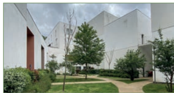
STAINS. Duplex 91.89 m². Dans une résidence récente, magnifique DUPLEX, belle pièce de vie avec cuisine équipée ouverte avec îlot centrale, une chambre avec salle d'eau, un WC séparé. A l'étage 2 chambres dont une suite parentale avec DRESSING et salle de bains, une salle de jeux et/ou bureau. une place de parking fermée. - 300 000 €