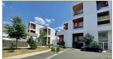
STAINS. Magnifique F2 de 44,10m² dans une résidence de standing de 2016. Appartement totalement équipé avec lit escamotable de grande qualité. Composé ainsi: Entrée avec rangements, séjour donnant sur une superbe terrasse, cuisiné totalement équipé, chambre, salle d'eau. Place de parking. Faibles charges. Il ne vous reste plus qu'à poser vos valises !! - 169 000 €