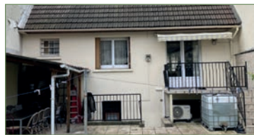
GARGES-LES-GONESSE. Nous vous proposons dans le quartier recherché de la LUTICE, cette maison d'environ 90m² habitable sur 280m² de terrain. Un séjour traversant, une belle cuisine équipée, au rez de chaussée une chambre. A l'étage, 2 chambres, un bureau, une salle de bains et WC séparé. Un sous-sol total aménagé avec cuisine d'été, WC et débarras, salle de jeu et un garage. En extérieur, 2 terrasses + jardin. - 340 000 €