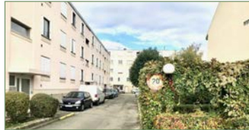
STAINS. beau F4 82m² Rue Jean Durand) dans une résidence privée et sécurisée construit en 1956. Situé au dernier étage, composé ainsi: Une entrée ouverte, cuisine spacieuse, séjour lumineux, dégagement, 3 chambres, salle d'eau et WC séparé, loggia fermée. Vous disposez d'un box fermé et sécurisé ainsi qu'une cave. Faible charges - 180 000 €