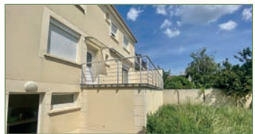
STAINS. Coup de cœur assuré pour ce magnifique pavillon de 2016 composé de 7 pièces de 170m² dans le quartier recherché. Vaste entrée lumineuse, chambre, grand double séjour traversant, cuisine totalement équipée, salle de bains. 1 er : Beau palier desservant 4 chambres spacieuses et lumineuses, salle de bains. Sous-sol entièrement aménagé avec cuisine et vaste séjour. Volets électriques, ainsi qu'une place de parking. Nous avons hâte de vous la présenter !! - 580 000 €