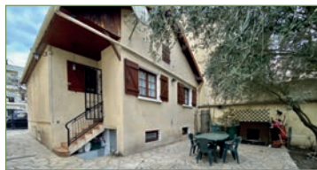
STAINS. beau plain pied proche CARREFOUR et de la future station de métro ainsi qu'une station de tramway de la gare La Courneuve - Six Routes. Composé ainsi: Entrée, cuisine ouverte sur séjour lumineux, 2 belles chambres, salle de bains, WC. Au Rez de jardin un studio indépendant avec chambre, cuisine, salle d'eau avec WC. Parcelle de 296m². Beau potentiel !! Garage. Combles pour rangements. - 294 000 €