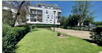
GARGES-LES-GONESSE. Dans résidence récente et sécurisée un beau F3 (59m²) totalement équipé. Entrée avec rangements, WC, salle d'eau, séjour, cuisine séparée et équipée, 2 chambres. Place de parking. Faible charges... - 205 000 €