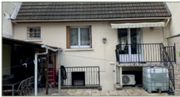
GARGES-LES-GONSESSE. Nous vous proposons dans le quartier recherché de la LUTECÉ, cette maison d'environ 90m 2 habitable sur 280m 2 de terrain. Un séjour traversant, une belle cuisine équipée, au rez de chaussée une chambre. A l'étage, 2 chambres, un bureau, une salle de bains et WC séparé. Un sous-sol total aménagé avec cuisine d'été, WC et débarras, salle de jeu et un garage. En extérieur, 2 terrasses + jardin. 340 000 €