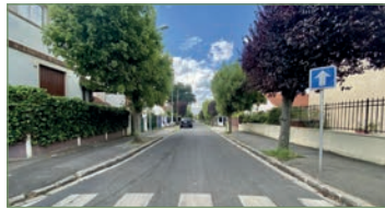
STAINS. Maison d'exception (110 m 2 ) sur le secteur de l'AVENIR. Sur une parcelle de 368m 2 pavillon sans aucun travaux. Entrée, grand et beau séjour, cuisine haut de gamme, WC. 1er: 2 chambres avec chacune leur salle de bains. Matériaux d'exception utilisés pour toute la maison. 2 garages couverts. 1 studio de 26m 2 totalement indépendant. Sous-sol. Coup de coeur assuré!! - 530 000 €