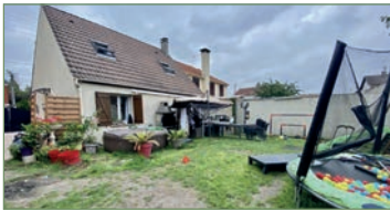
PIERREFITTE-SUR-SEINE. Charmante maison familiale de type F5 (90m 2 ) sur 2 niveaux, éditée sur 230 m de terrain proche gare de PIERREFITTE-STAINS. Au rez-de-chaussée, un double-séjour traversant et lumineux avec cuisine américaine et équipée, une chambre, salle de bain et WC. A l'étage, vous découvrirez 2 belles chambres et un dressing ou bureau (possibilité salle d'eau). Adaptée PMR Coup de coeur assuré!! - 314 000 €