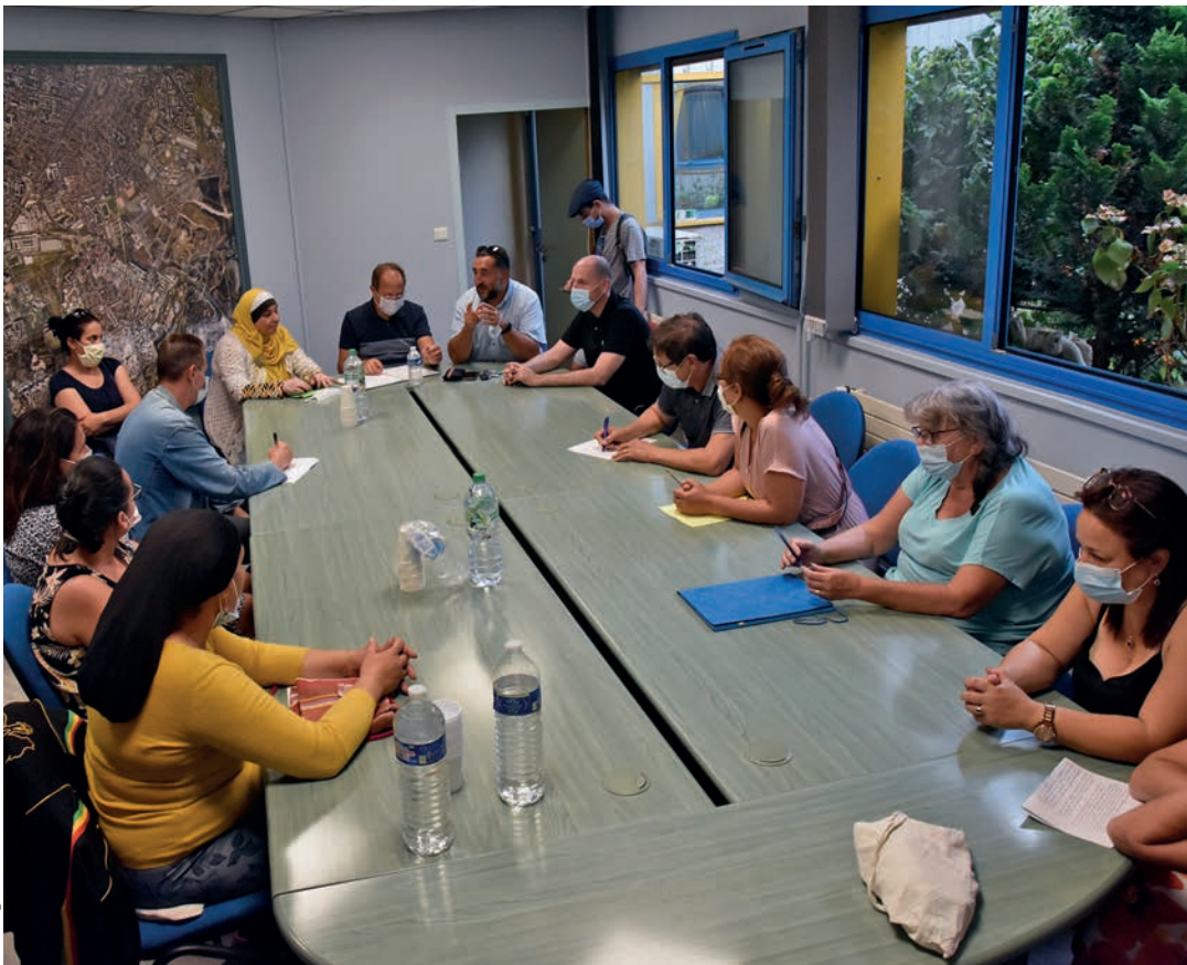
Le collectif de la Cerisaie travaille à l'amélioration de leur cadre de vie.

Le collectif des habitants du quartier de La Cerisaie, qui s'est constitué cet été, réussit à faire grandir ses rangs et a eu un retour de la préfecture au sujet de l'évacuation du squat du Maestro Grill. Leur objectif : améliorer leur cadre de vie.