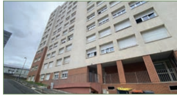
GARGES-LES-GONSESSE. Dans un immeuble du centre ville, appartement 64,4 m 2 type F3 comprenant une entrée avec placard, séjour avec balcon, cuisine séparée, salle de bain, WC séparé, 2 chambres... Ce bien est complété par une cave et une place de parking en sous-sol. - 140 000 €