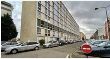
GARGES-LES-GONSESSE. grand F2 LOUÉ de 46m 2 situé proche mairie et transports. Composé ainsi: Entrée, cuisine, séjour, chambre, salle de bain, WC, et rangements. Idéal investisseur - 110 000 €