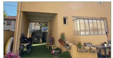
STAINS. Secteur de l'avenir, idéal invest. locatif ou pour gde famille, sur un terr. d'env. 320 m 2 . 3 maisons, 1 à l'avant du terrain sur rue et à l'arrière, 2 maisons identiques, avec RDC, séjour et cuis. ouverte, au 1 er ét. 2 ch., salle d'eau WC, au 2 e ét., 2 ch. enf., salle d'eau WC, sous-sol total. Avec terr. fermées et jardins. Maison à l'avant a une gde cuis. ouverte avec salle à manger, un séjour, 3 ch., salle d'eau avec WC. Produit rare. - 850 000 €