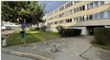
STAINS. Beau F4 dans résidence recherchée BOIS DE L'AUNAY proche transports. Composé ainsi: Entrée, séjour, cuisine séparée, 3 chambres, salle de bains, WC. Plusieurs rangements, appartement lumineux. - 177 000 €