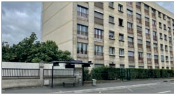
STAINS. beau F3 de 53m 2 à 10 min à pied de la gare de STAINS. Composé ainsi: Entrée, cuisine, beau séjour donnant sur une terrasse de 30m 2 , salle de bains, WC, deux chambres donnant sur une terrasse. - 167 000 €