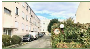
STAINS. beau F4 82m 2 Rue Jean Durand dans une résidence privée et sécurisée construite en 1956. Situé au dernier étage, composé ainsi: Une entrée ouverte, cuisine spacieuse, séjour lumineuse, dégagement, 3 chambres, salle d'eau et WC séparé, loggia fermée. Vous disposez d'un box fermé et sécurisé ainsi qu'une cave. Faibles charges - 180 000 €