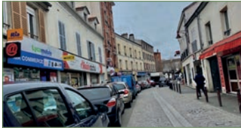
STAINS. En plein centre ville, proche des commerces et des transports, au 3 e et dernier étage, joli F2 (52 m 2 ) très propre, dans un immeuble ancien, composé, d'une entrée, un séjour, une cuisine séparée aménagée, une salle d'eau, un WC séparé. FAIBLES CHARGES. - 130 000 €