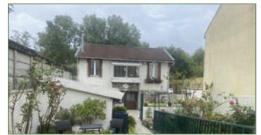
STAINS. beau pavillon 90 m 2 sur 2 niveaux proche CARREFOUR. Entrée, cuisine, séjour, salle à manger, salle de bains avec WC, rangements. 1er: un palier dessert 2 chambres, et un grand séjour. Beaucoup de potentiel! Le tout sur une parcelle de 252m 2 . Idéal investisseur ou première acquisition!! 249 000 €