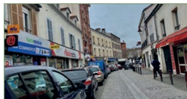
STAINS. proche Mairie beau F3 de 54m 2 de surface totale. Composé ainsi: Entrée, séjour, cuisine, 2 chambres, salle de bains, WC. Cave - 150 000 €