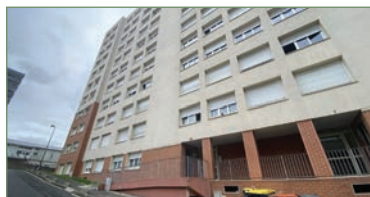
GARGES-LES-GONSESSE. Dans un immeuble du centre ville, appartement 64,4 m 2 type F3 comprenant une entrée avec placard, séjour avec balcon, cuisine séparée, salle de bain, WC séparé, 2 chambres... Ce bien est complété par une cave et une place de parking en sous-sol. - 140 000 €