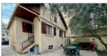
STAINS. beau plain pied proche CARREFOUR et de la future station de métro ainsi qu'une station de tramway de la gare La Courmeuve - Six Routes. Composé ainsi: Entrée, cuisine ouverte sur séjour lumineux, 2 belles chambres, salle de bains, WC. Au Rez de jardin un studio indépendant avec chambre, cuisine, salle d'eau avec WC. Parcelle de 296m 2 . Beau potentiel !! Garage. Combles pour rangements. 294 000 €