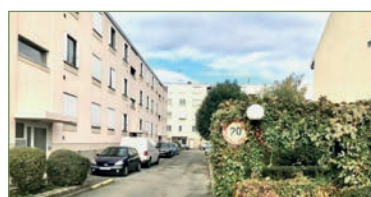
STAINS. beau F4 82m 2 Rue Jean Durand dans une résidence privée et sécurisée construit en 1956. Situé au dernier étage, composé ainsi: Une entrée ouverte, cuisine spacieuse, séjour lumineux, dégagement, 3 chambres, salle d'eau et WC séparé, loggia fermée. Vous disposez d'un box fermé et sécurisé ainsi qu'une cave. Faible charges - 180 000 €