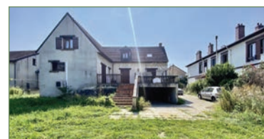
GARGES-LES-GONSESSE. magnifique pavillon de 180m 2 secteur de la LUTECE. Rez-de-chaussée: Entrée, double séjour, cuisine, salle de bains, chambre. 1er: Entrée, buanderie, WC, cuisine avec espace à manger, WC, salle de bains, 3 chambres. Le rez-de-chaussée avec travaux. Pompe à chaleur. Sous-sol total. Le tout sur une parcelle de 870m 2 - 535 000 €