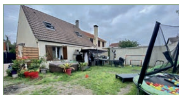
PIERREFITTE-SUR-SEINE. Charmante maison familiale de type F5 (90m 2 ) sur 2 niveaux, édifiée sur 230 m de terrain proche gare de PIERREFITTE-STAINS. Au rez-de-chaussée, un double-séjour traversant et lumineux avec cuisine américaine et équipée, une chambre, salle de bain et WC. À l'étage, vous découvrirez 2 belles chambres et un dressing ou bureau (possibilité salle d'eau). Adaptée PMR Coup de coeur assuré !! - 314 000 €