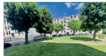
STAINS. beau F3 de 54m 2 proche CARREFOUR de STAINS. Composé ainsi : Entrée avec buanderie, WC, salle d'eau, séjour, cuisine, 2 chambres. Place de parking. Cave. 165 000 €