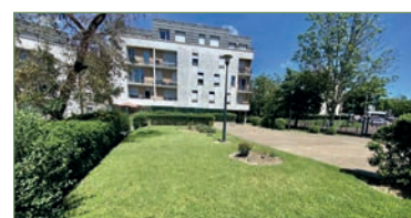
GARGES-LES-GONSESSE. Dans résidence récente et sécurisée un beau F3 (59m 2 ) totalement équipé. Entrée avec rangements, WC, salle d'eau, séjour, cuisine séparée et équipée, 2 chambres. Place de parking. Faible charges. - 200 000 €