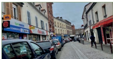
STAINS. En plein centre ville, proche des commerces et des transports, au 3 e et dernier étage, joli F2 (32 m 2 ) très propre, dans un immeuble ancien, composé, d'une entrée, un séjour, une cuisine séparée aménagée, une salle d'eau, un WC séparé. FAIBLES CHARGES. - 120 000 €