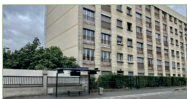
STAINS. beau F3 de 53m 2 à 10 min à pied de la gare de STAINS. Composé ainsi: Entrée, cuisine, beau séjour donnant sur une terrasse de 30m 2 , salle de bains, WC, deux chambres donnant sur une terrasse. - 167 000 €