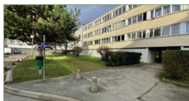
STAINS. Beau F4 dans résidence recherchée BOIS DE L'AUNAY proche transports. Composé ainsi: Entrée, séjour, cuisine séparée, 3 chambres, salle de bains, WC. Plusieurs rangements, appartement lumineux. - 177 000 €