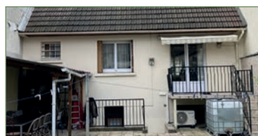
GARGES-LES-GONSESSE. Nous vous proposons dans le quartier recherché de la LUTECE, cette maison d'environ 90m 2 habitable sur 280m 2 de terrain. Un séjour traversant, une belle cuisine équipée, au rez de chaussée une chambre. À l'étage, 2 chambres, un bureau, une salle de bains et WC séparé. Un sous-sol total aménagé avec cuisine d'été, WC et débarras, salle de jeu et un garage. En extérieur, 2 terrasses + jardin. 340 000 €