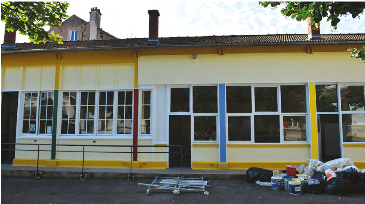
L'école primaire Joliot-Curie durant sa réhabilitation, cet été

La réhabilitation des écoles et l'amélioration du cadre de vie ont été au menu du Conseil municipal de rentrée qui s'est tenu jeudi dernier.