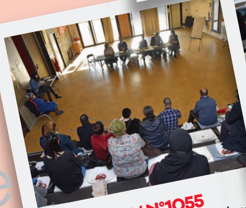
Éd. 27 MAI / N°1055 Premier Conseil d'habitants depuis le début de la crise sanitaire.