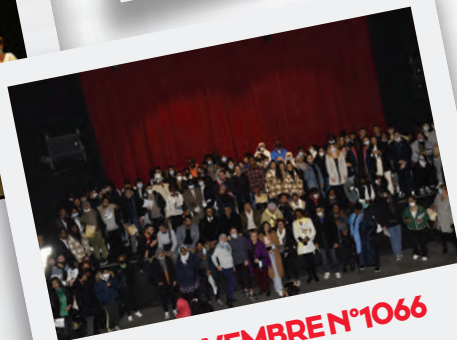
Éd. 25 NOVEMBRE N°1066 La cérémonie des bacheliers. 589 jeunes Stanois mis à l'honneur.