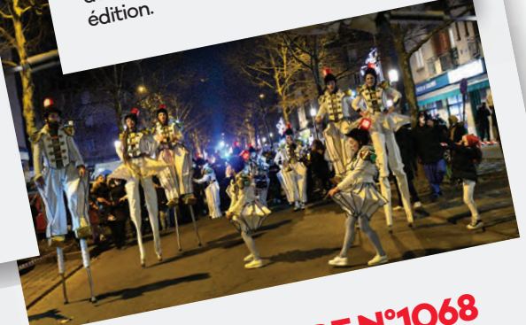
Éd. 23 DÉCEMBRE N°1068 Les Fêtes solidaires battent leur plein.