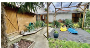
STAINS. Beau pavillon de plain pied dans le secteur recherché de l'AVENIR. Composé ainsi: Entrée, grand séjour de 50 m 2 ouvert sur cuisine, salle de bains + douche, 2 chambres, et chambre d'enfant. Climatisation et volets électriques. Parking. Grand F2 au fond de la parcelle sans aucun travaux. Le tout sur une parcelle de 336 m 2 . - 329 000 €