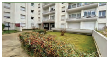
GARGES-LÈS-GONESSE. beau F3 de 72m 2 refait à neuf. Situé au 3 ème étages il est composé ainsi: Entrée, cellier, cuisine, séjour donnant sur balcon, deux chambres, salle de bains, WC. Parking en sous-sol. - 182 000 €