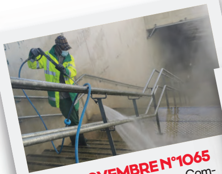
Éd. 11 NOVEMBRE N°1065 La Régie de quartier, Plaine Commune et la ville redoublent d'efforts pour nettoyer le souterrain entre les rues Chardavoine et du Moutier.