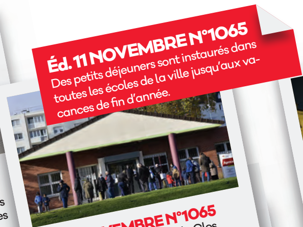
Éd. 11 NOVEMBRE N°1065 Des petits déjeuners sont instaurés dans toutes les écoles de la ville jusqu'aux vacances de fin d'année.