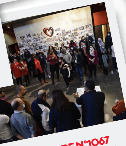
Éd. 9 DÉCEMBRE N°1067 Le Forum du bénévolat a permis aux associations de rencontrer des bénévoles et vice versa.