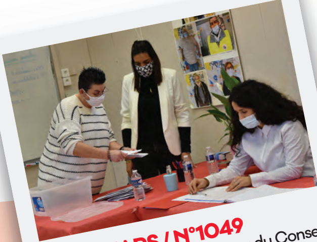
Éd. 4 MARS / N°1049 Élection du nouveau bureau du Conseil local de la vie associative (CLVA).