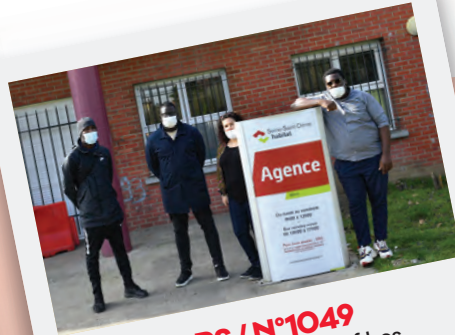
Éd. 4 MARS / N°1049 Rencontre avec le collectif Les locataires en colère, regroupement d'habitants du Clos Saint-Lazare en conflit avec leur bailleur SSDH.