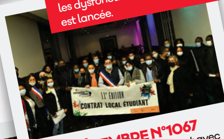
Éd. 9 DÉCEMBRE N°1067 71 étudiants signent un contrat avec des associations, c'est le CLE, 11 e édition.