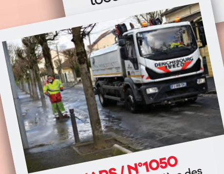
Éd. 18 MARS / N°1050 Coup d'envoi de la première des douze Grandes lessives en ville, dans le quartier de l'Avenir.