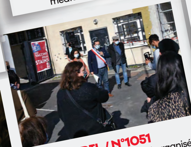
Éd. 15 AVRIL / N°1051 Une conférence de presse est organisée devant le Centre municipal de santé pour exiger l'ouverture d'un centre de vaccination en ville.