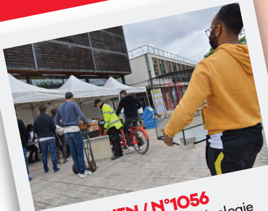
Éd. 10 JUIN / N°1056 Coup d'envoi du Mois de l'écologie à travers de multiples événements dédiés.