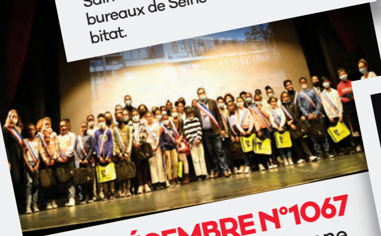
Éd. 9 DÉCEMBRE N°1067 Après des élections en bonne et due forme, les nouveaux conseillers municipaux des enfants du CME reçoivent leurs écharpes.