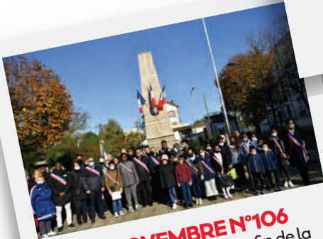
Éd. 25 NOVEMBRE N°106 103 e commémoration de la fin de la Première Guerre mondiale.