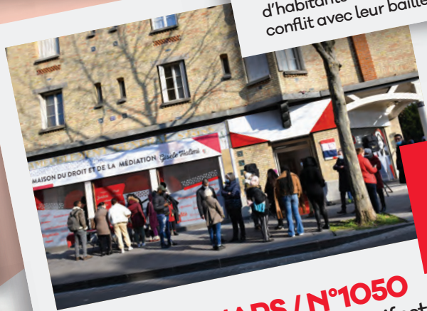
Éd. 18 MARS / N°1050 Le mois de l'Égalité, manifestation promue par la municipalité, s'ouvre à travers l'inauguration de la nouvelle Maison du droit et de médiation, Gisèle Halimi.