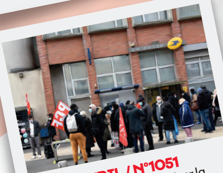
Éd. 1 ER AVRIL / N°1051 Un rassemblement pour exiger la réouverture de la Poste du Clos Saint-Lazare en présence de plusieurs élus dont le maire Azzédine Taïbi.