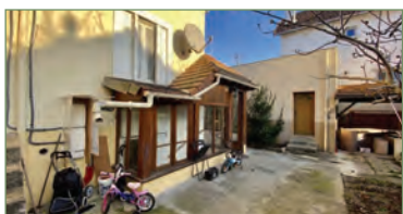
STAINS. Maison 71 m 2 - 5 pièces. Beau pavillon situé dans le secteur recherché de l'AVENIR. Pavillon divisé en plusieurs lots. Garage Le tout sur une parcelle de 245m 2 . - 289 000 €