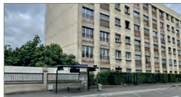
STAINS. beau F3 de 53m 2 à 10 min à pied de la gare de STAINS. Composé ainsi: Entrée, cuisine, beau séjour donnant sur une terrasse de 30m 2 , salle de bains, WC, deux chambres donnant sur une terrasse. - 167 000 €