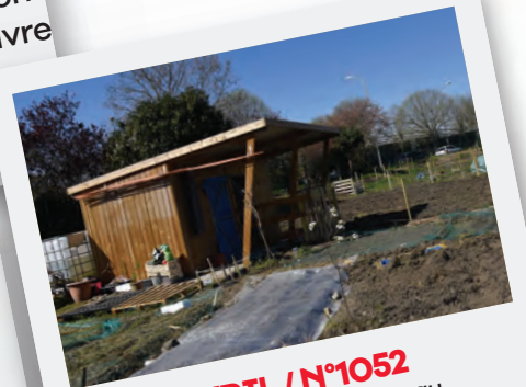
Éd. 15 AVRIL / N°1052 La zone des Arpents fait peau neuve, lieu de jardinage et de déambulation, elle est ouverte à tous les Stanois.