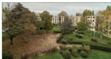
GARGES-LÈS-GONESSE. Dans une grande résidence fermée, dans le quartier de la Lutece, très beau F4 de 92 m 2 au 4 ème et dernier étage, avec possibilité de faire une chambre de plus. Quelques travaux sont à prévoir. - 175 000 €