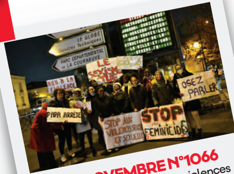
Éd. 25 NOVEMBRE N°1066 Stains mobilisée contre les violences faites aux femmes.