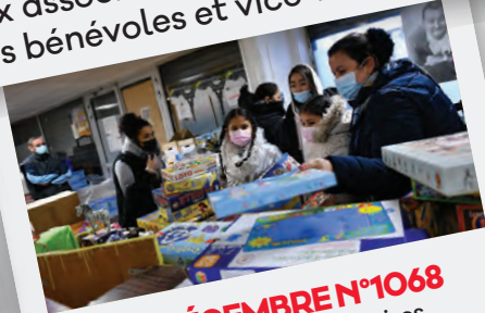
Éd. 23 DÉCEMBRE N°1068 Plusieurs associations stanoises se mobilisent dans des actions de solidarité.