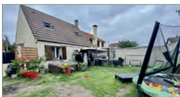
PIERREFITTE-SUR-SEINE. Charmante maison familiale de type F5 (90m 2 ) sur 2 niveaux, éditée sur 230 m 2 de terrain proche gare de PIERREFITTE-STAINS. Au rez-de-chaussée, un double-séjour traversant et lumineux avec cuisine américaine et équipée, une chambre, salle de bain et WC. A l'étage, vous découvrirez 2 belles chambres et un dressing ou bureau (possibilité salle d'eau). Adaptée PMR Coup de coeur assuré !! - 314 000 €