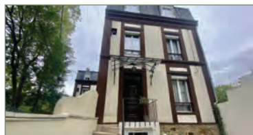
EPINAY-SUR-SEINE. LIMITE DEUIL LA BARRE PROCHE DE LA GARE SNCF LIGNE H. Maison de caractère de 190m 2 composée ainsi: Entrée, séjour de 28m 2 , cuisine équipée ouvrant sur terrasse et jardin, 5 chambres, salle de bains, salle d'eau, 2 wc. Rez-de-jardin aménagé avec salon et cuisine, buanderie, combles aménagés, jardin. Le tout sur une parcelle de 360m 2 . AUCUN TRAVAUX A PREVOIR. - 499 000 €