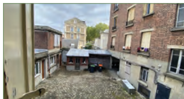
PIERREFITTE-SUR-SEINE. Bas Butte Pinson, dans un immeuble ancien, au 1er étage sur cour, grand F2 composé d'un beau séjour avec cuisine ouverte, une chambre avec placard, un dégagement avec salle d'eau et WC. - 139 000 €