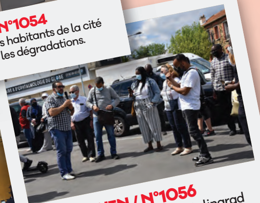
Éd. 10 JUIN / N°1056 Rassemblement avenue Stalingrad pour protester contre les corona- pistes en présence de plusieurs élus.