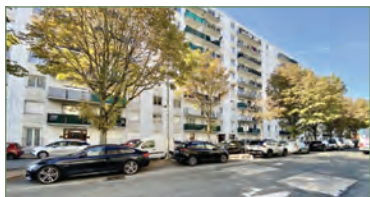
GARGES-LÈS-GONESSE. Appartement de type F2 de 50m 2 idéalement situé proche Mairie. Il comprend, une entrée, un grand séjour donnant sur un balcon, une cuisine fermée, une chambre, une salle de bains, WC. Cave en sous-sol. IDEAL PREMIERE ACQUISITION OU INVESTISSEUR !!! Charges annuelles 2665 euros. - 118 000 €