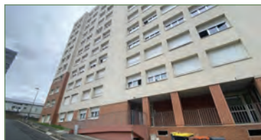
GARGES-LÈS-GONESSE. Dans un immeuble du centre ville, appartement 64,4 m 2 type F3 comprenant une entrée avec placard, séjour avec balcon, cuisine séparée, salle de bain, WC séparé, 2 chambres... Ce bien est complété par une cave et une place de parking en sous-sol. - 140 000 €