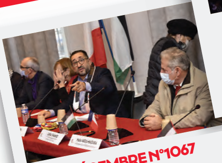
Éd. 9 DÉCEMBRE N°1067 Une conférence de presse, en présence de plusieurs élus d'Île-de-France, se tient en mairie pour dénoncer le traitement qui leur est réservé du fait de leur engagement en faveur de la cause palestinienne.