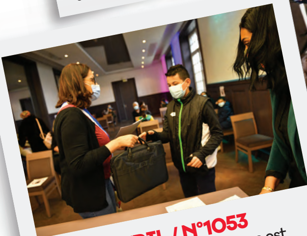
Éd. 29 AVRIL / N°1053 Une distribution d'ordinateurs est organisée en mairie pour lutter contre la fracture numérique.