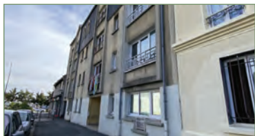
STAINS. Louis Bordes - Dans un petit immeuble, au 3 ème et dernier étage, appartement type F3 en DUPLEX, au rez de chaussée un beau séjour lumineux, une cuisine séparée et équipée, un WC, à l'étage un dégagement avec placard, 2 chambres légèrement mansardées et une salle d'eau avec WC et douche à l'italienne. Aucun travaux à prévoir. Ce bien est complété par une place de parking en extérieur. - 170 000 €