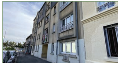
STAINS. Louis Bordes - Dans un petit immeuble, au 3 e et dernier étage, appartement type F3 en DUPLEX, au rd: un beau séj. lumineux, une cuis. séparée et équipée, un WC, à l'étage un dégagement avec placard, 2 ch. légèrement mansardées et une salle d'eau avec WC et douche à l'italienne. Aucun travaux à prévoir. Ce bien est complété par une place de parking en extérieur. - 167 000 €