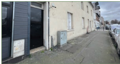
STAINS. F2 proche CARREFOUR d'une superficie de 27m 2 . Composé ainsi : Entrée, séjour avec cuisine ouverte, salle d'eau, WC. Faible charges. - 112 000 €