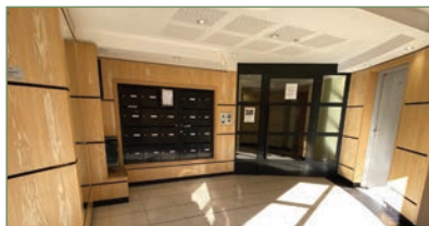
VILLETANEUSE. Dans une résidence fermée et sécurisée, bel appartement EN REZ DE JARDIN (73,85 m 2 ) de type 4 pièces, composé d'un séjour avec une belle cuisine ouverte équipée, 3 chambres donnant sur les terrasses, 1 salle de bains, un WC séparé, un dégagement avec placard. Ce bien est complété par une place de parking en sous-sol - 185 000 €