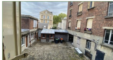
PIERREFITTE-SUR-SEINE. Bas Butte Pinson, dans un immeuble ancien, au 1 er étage sur cour, grand F2, vendu loué, composé d'un beau séjour avec cuisine ouverte, une chambre avec placard, un dégagement avec salle d'eau et WC. - 132 000 €