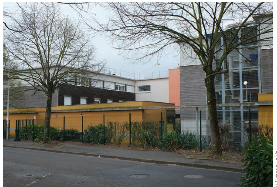
La résidence Adoma dans la Zone d'activité de La Cerisaie.

Effectivement, la Préfecture avait missionné une association venant en aide aux sans-abris. C'était pendant le premier confinement, il me semble. Premièrement, il convient de dire qu'en tant que municipalité, nous faisons beaucoup de choses pour apporter des solutions à ce type de situation, même si nous n'en faisons jamais assez, c'est sûr. Le problème ici, c'est que personne n'a été concerté, que ce soit les élus ou les riverains. Je comprends donc leur réaction. Ce que nous regrettons, c'est que ce sont toujours les villes comme Stains, qui prennent cette responsabilité, nous ne sommes pas égaux sur le territoire. Ici, notre ligne, c'est d'aider les gens en difficulté, mais ce serait bien que d'autres villes s'y mettent aussi.