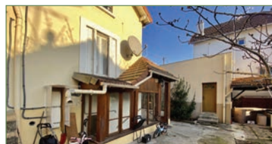
STAINS. Beau pavillon situé dans le secteur recherché de l'AVENIR. Pavillon divisé en plusieurs lots. Garage Le tout sur une parcelle de 245m 2 . - 289 000 €