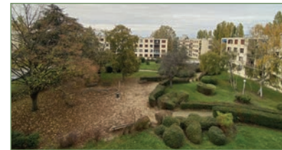
GARGES-LES-GONSESSE. Dans une grande résidence fermée, dans le quartier de la Lutece, tres beau F4 de 92 m 2 au 4 e et dernier étage, avec possibilité de faire une chambre de plus. Quelques travaux sont à prévoir. - 173 000 €