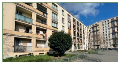
GARGES-LES-GONSESSE. Beau F4 face à la gare. Composé ainsi : Entrée, séjour, cuisine, salle de bains, WC, 3 chambres. Place de parking extérieur. Cave. - 192 000 €