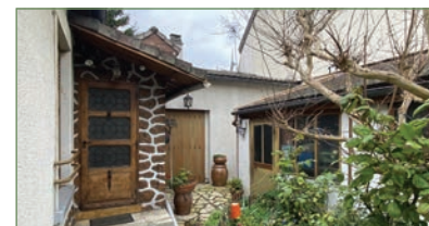
STAINS. Dans le quartier des prévoyants, charmante maison de plain-pied avec cuisine et coin repas, un double grand séjour traversant avec cheminée, 2 ch. et un garage indépendant. Une cave et un beau jardin à l'avant et l'arrière. Le tout sur un terrain de 330m 2 environ - 289 000 €