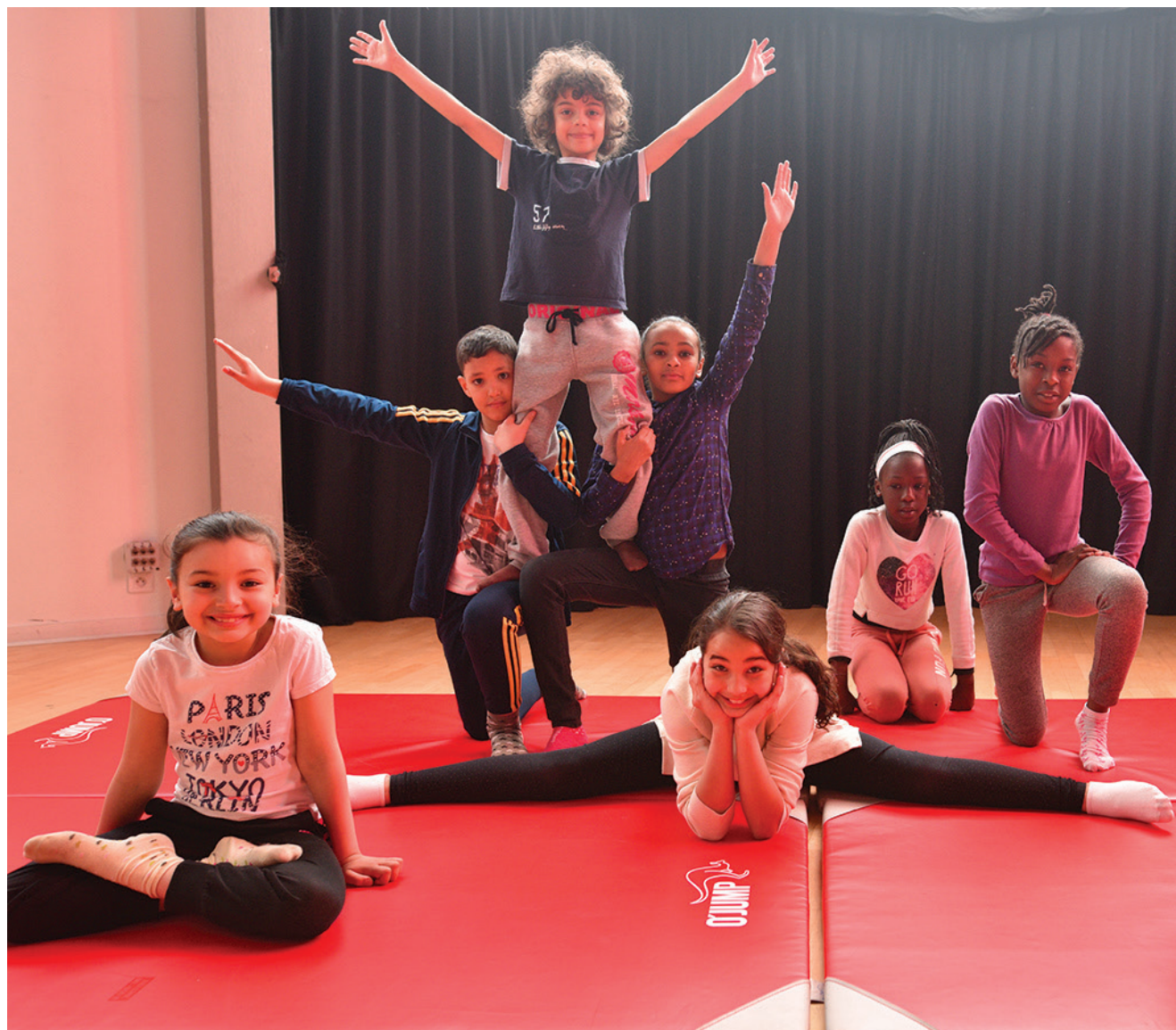
Des activités, notamment autour du cirque seront proposées aux jeunes Stanois.