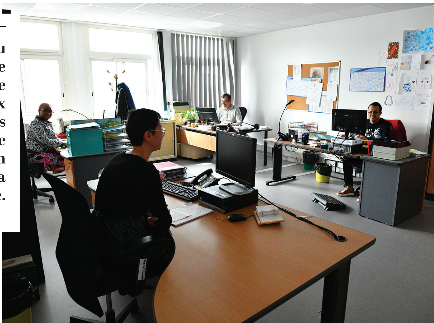
Les agents du service Logement accompagnent les Stanois dans leurs démarches.

Un nouveau protocole de demande d'audience aux élus sur les questions de logement est en place depuis la semaine dernière.