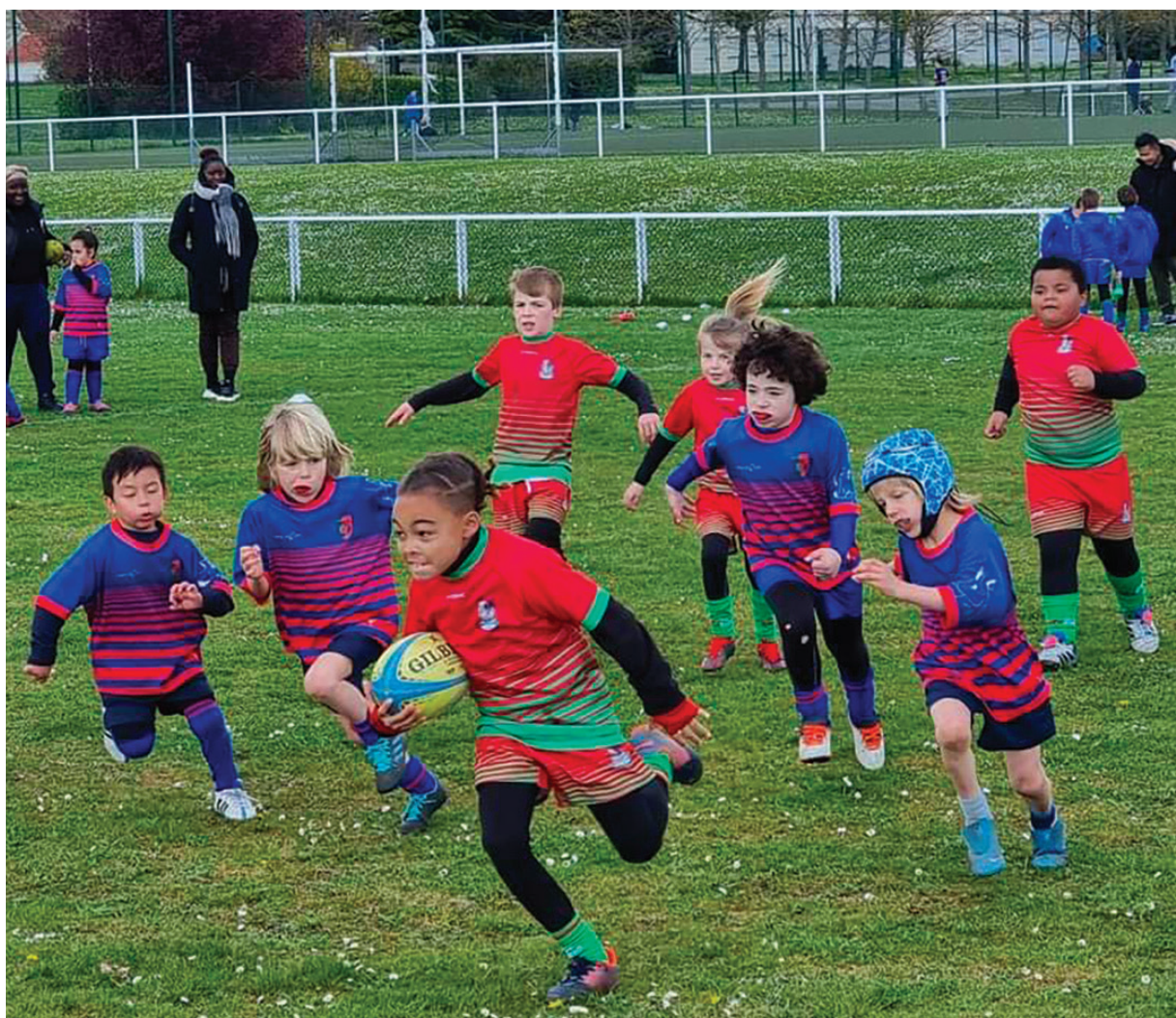
Samedi dernier, nos petits verts et rouges et leurs invités sur la Plaine Delaune.

Alors que le XV de France a brillamment remporté le Tournoi des Six Nations, le club stanois de rugby continue de faire grandir ses jeunes pousses.