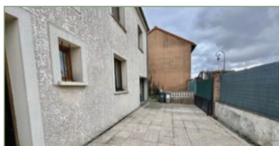
GARGES-LES-GONSESSE. Beau pavillon, 4 pièces 100 m 2 , SECTEUR LA LUTECE composé ainsi : Entrée, cuisine ouverte sur séjour. À l'étage 3 chambres, salle de bains. Combles. - 315 000 €