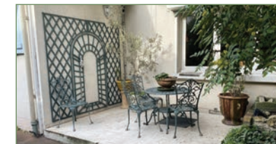
PIERREFITTE-SUR-SEINE. Magnifique Bien ! Très belle maison familiale composée de 2 parties séparables. Séj. cuis., salon, à l'étage 2 chs, 1 sdb. L'autre partie toute en longueur sur des demi niveaux, avec une tres grande cuis. ouverte avec salle à manger, un séjour, 3 chs, 1 sde, un dressing, un grand bureaux très lumineux pouvant être transformé en chs avec point d'eau. Une piscine couverte et intérieure une cave à vin et de nombreux débarras et caves. En rez de chaussée, un hangar, des ateliers, des bureaux. En extérieur de nombreux boxes, une serre et un immense jardin sans vis à vis - 990 000 €