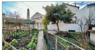
STAINS. 2 beaux pavillons en plein secteur de l'AVENIR. 1 er pavillon: Entrée, WC, double séjour, cuisine, salle d'eau, 2 chambres.(82 m 2 ) Ensuite à l'étage: Entrée, salle de bains, séjour, cuisine, 2 chambres.(50 m 2 ) 2 e pavillon: Entrée, WC, salle d'eau, cuisine, grand séjour, 2 chambres. - 555 000 €