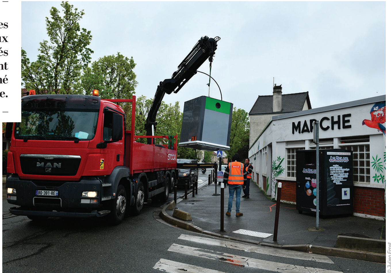
L'installation des dernières bornes durera encore quelques jours. Mercredi, 13 ont été posées dont celle du marché de l'Avenir.

SUR LES JOURS DE COLLECTE DES DÉCHETS RUE PAR RUE SUR WWW.PLAINECOMMUNE.FR/COLLECTE/