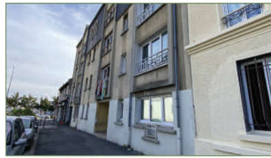
STAINS. Louis Bordes - Dans un petit immeuble, au 3 e et dernier ét., app. type F3 en DUPLEX, au rdc un beau séj. lumineux, une cuis. séparée et équipée, un WC, à l'ét. un dégagement avec placard, 2 ch. légèrement mansardées et une salle d'eau avec WC et douche à l'italienne. Aucun travaux à prévoir. Ce bien est complété par une place de parking en extérieur. - 163 000 €