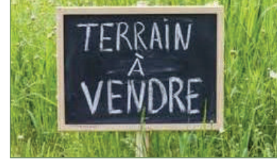
PIERREFITTE-SUR-SEINE. Beau terrain de 230m 2 constructible. 5 Boxes sur la parcelle à détruire. A 15 Min à pied de la gare de PIERREFITTE. - 175 000 €