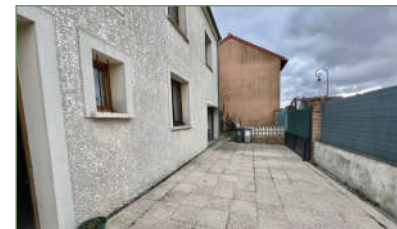
GARGES-LES-GONÈSSE. Beau pavillon, 4 pièces 100 m 2 , SECTEUR LA LUTECE composé ainsi : Entrée, cuisine ouverte sur séjour. À l'étage 3 chambres, salle de bains. Combles. - 310 000 €