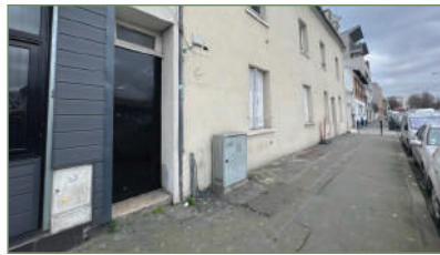
STAINS. F2 proche CARREFOUR d'une superficie de 27m 2 . Composé ainsi : Entrée, séjour avec cuisine ouverte, salle d'eau, WC. Faible charges. 107 000 €