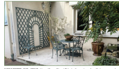
PIERREFITTE-SUR-SEINE. Magnifique Bien ! Très belle maison familiale composée de 2 parties séparables. Séj. cuis., salon, à l'étage 2 chs, 1 sdb. L'autre partie toute en longueur sur des demi niveaux, avec une très grande cuis. ouverte avec salle à manger, un séj., 3 chs, 1 sdb, un dressing, un grand bureaux très lumineux pouvant être transformé en ch avec point d'eau. Une piscine couverte et intérieure une cave à vin et de nombreux débarras et caves. En rdc, un hangar, des ateliers, des bureaux. En extérieur de nombreux boxes, une serre et un immense jardin sans vis à vis - 840 000 €