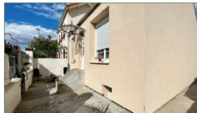
VILLETANEUSE. Beau pavillon sans travaux. Proche du tramway T5 et plusieurs lignes de bus. Entrée, séjour, cuisine, salle de bains, 2 ch. Grenier de 60m 2 aménageable. s-s total complètement aménagé. Deux dépendances à l'arrière de la maison. - 314 000 €