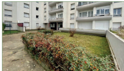
GARGES-LES-GONÈSSE. beau F3 de 72m 2 refait à neuf. Situé au 3 e étages il est composé ainsi: Entrée, cellier, cuisine, séjour donnant sur balcon, deux chambres, salle de bains, WC. Parking en sous-sol. - 182 000 €