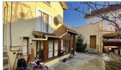
STAINS. Beau pavillon situé dans le secteur recherché de l'AVENIR. Pavillon divisé en plusieurs lots. Garage. Le tout sur une parcelle de 245m 2 . - 279 000 €