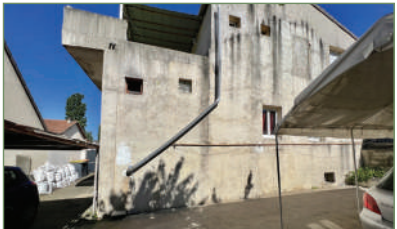
GARGES-LES-GONÈSSE. Maison 110 m 2 - 6 pièces - Pavillon divisé en deux lots. Situé dans le secteur recherché de la LUTECE. Possibilité de garer plusieurs véhicules. Le tout sur une parcelle de 198m 2 . Idéal investisseur. - 324 000 €