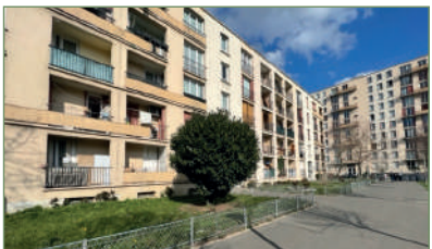
GARGES-LES-GONÈSSE. Beau F4 face à la gare. Composé ainsi : Entrée, séjour, cuisine, salle de bains, WC, 3 chambres. Place de parking extérieur. Cave. 192 000 €