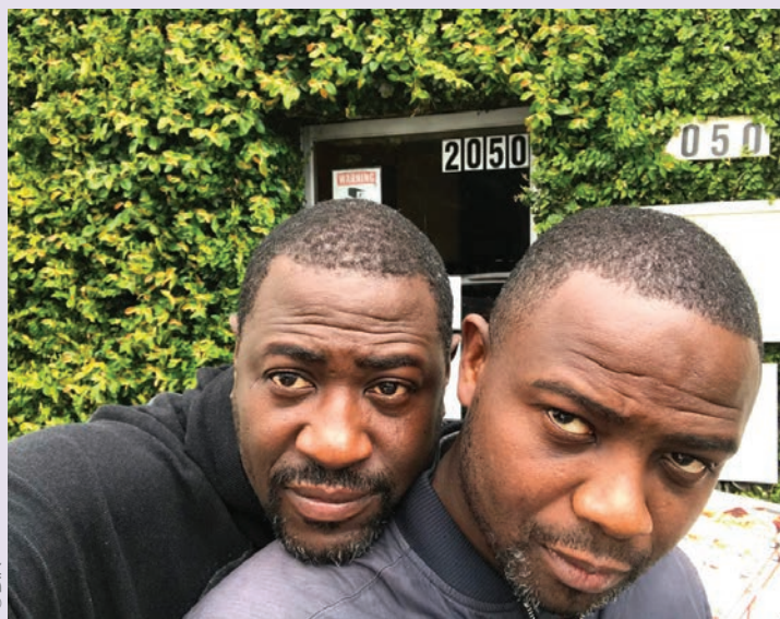
De gauche à droite, Cédric & Jacky

Cédric Ido, acteur, scénariste et réalisateur Stanois continue de faire parler de lui à travers le monde. En effet, il y a quelques jours, il était à Toronto pour présenter son dernier film, la Gravité au prestigieux «Toronto international film festival 2022» (TIFF). Le film, également au programme du festival d'Oldenburg (Allemagne), est aussi en compétition officielle au Festival international du film francophone de Namur (Fiff). Il ne reste plus qu'à attendre la distribution grand public de ce fantastique drame.