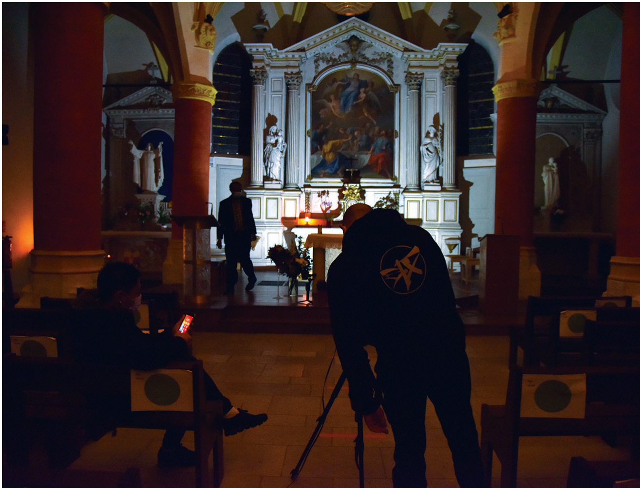
Notre dame de l'Assomption a été le décor de la première édition de la Nuit Blanche organisée par la galerie Tâches d'Art en 2020.