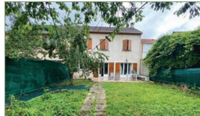
STAINS. Beau pavillon (110 m 2 - 5 pièces) en plein secteur de l'AVENIR. Composée ainsi : Entrée, grand séjour lumineux donnant sur jardin, cuisine séparée. À l'étage : un beau palier dessert 3 chambres, une salle de bains, WC séparé. Un studio complément indépendant est loué et permet une rente mensuelle 345 000 €