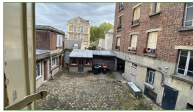
PIERREFITTE-SUR-SEINE. Bas Butte Pinson, dans un immeuble ancien, au 1 er étage sur cour, grand F2, vendu loué, composé d'un beau séjour avec cuisine ouverte, une chambre avec placard, un dégagement avec salle d'eau et WC. 132 000 €