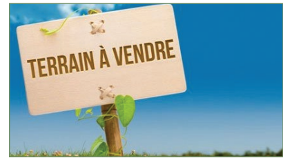
STAINS. Beau terrain constructible de 429m 2 dans le quartier pavillonnaire et recherché Jean Jaurès. La surface au plancher constructible est de 192m 2 . Proche des écoles, des commerces et de la gare RER D. Produit rare dans le secteur ! 226 800 €

URGENT NOUS RECHERCHONS MAISONS ET APPARTEMENTS À LOUER NOUS POUVONS GÉRER VOTRE BIEN AVEC ASSURANCE GARANTIE LOYERS IMPAYÉS