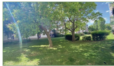
GARGES-LES-GONSESSE. Proche des pompiers et des écoles, un apt. type F4 en REZ DE CHAUSSEE surélevé, composé d'une entrée, un séj., une cuis. avec cellier, 3 chs, une sdb et WC séparés. Une cave complète ce bien. En extérieur place de parking en placement libre. Quelques travaux sont à prévoir. 155 000 €