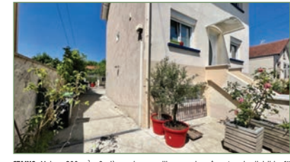
STAINS. Maison 200 m 2 - 9 pièces, deux pavillons sur le même terrain divisible. 1 er pavillon de 200 m 2 : Entrée, grand séjour lumineux, grande salle de bains, chambre. À l'étage : 3 belles chambres, salle de bains avec WC. Comble propre à aménager. Au rez-de-chaussée un appartement totalement indépendant avec son hall d'entrée, cuisine, 3 chambres, salle d'eau. 2 e pavillon de 90 m 2 : Entrée, salon, grande cuisine. À l'étage : 3 chambres, salle d'eau. Le tout sur une parcelle de 364m 2 . Idéal investisseur ou grande famille. - 940 000 €

L'HISTOIRE PASSIONNANTE ET ILLUSTRÉE DES RUES DE SAINT-DENIS RACONTÉE PAR MICHEL MIGETTE