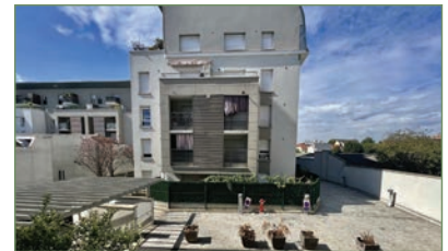
STAINS. Beau beau F2, 36 m 2 dans une résidence neuve de standing. Composé ainsi : Entrée, séjour, chambre, salle de bains avec WC. Place de Parking. 156 000 €