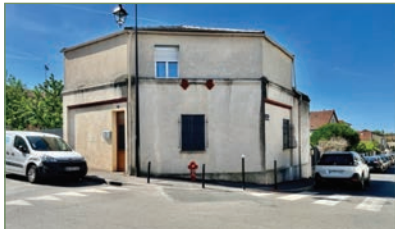
GARGES-LES-GONSESSE. Pavillon 110 m 2 , 6 pièces, divisé en deux lots. Situé dans le secteur recherché de la LUITECE. Possibilité de garer plusieurs véhicules. Le tout sur une parcelle de 198 m 2 . Idéal investisseur. 304 000 €