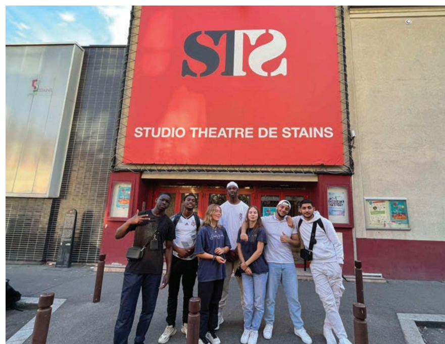
La troupe d'improvisation devant le STS préparent leur show.

Lancement de saison, reprise de spectacle et d'ateliers ou encore la fin des chantiers créatifs, un programme dense et attractif pour le théâtre local.