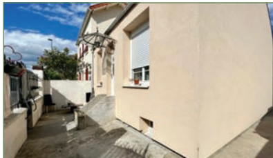
VILLETANEUSE. Beau pavillon sans travaux. Proche du tramway T5 et plusieurs lignes de bus. Entrée, séj., cuis., sdb, 2 ch. Grenier de 60m 2 aménageable. S-S total complètement aménagé. Sur une parcelle de 295 m 2 . Deux dépendances à l'arrière de la maison. 314 000 €