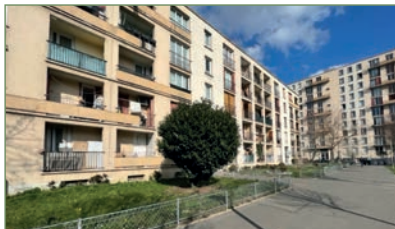
GARGES-LES-GONSESSE. Beau F4 face à la gare. Composé ainsi : Entrée, séjour, cuisine, salle de bains, WC, 3 chambres. Place de parking extérieur. Cave. 192 000 €

URGENT NOUS RECHERCHONS MAISONS ET APPARTEMENTS À LOUER NOUS POUVONS GÉRER VOTRE BIEN AVEC ASSURANCE GARANTIE LOYERS IMPAYÉS