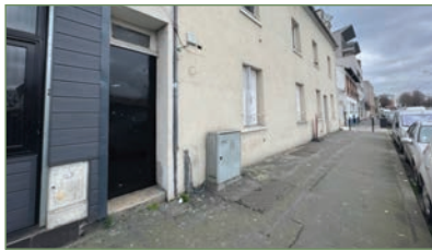
STAINS. Dans un immeuble au ravalement récent, petit studio en REZ DE CHAUSSEE, coin cuisine, salle d'eau. Aucun travaux à prévoir, ballon élec. neuf. 90 000 €