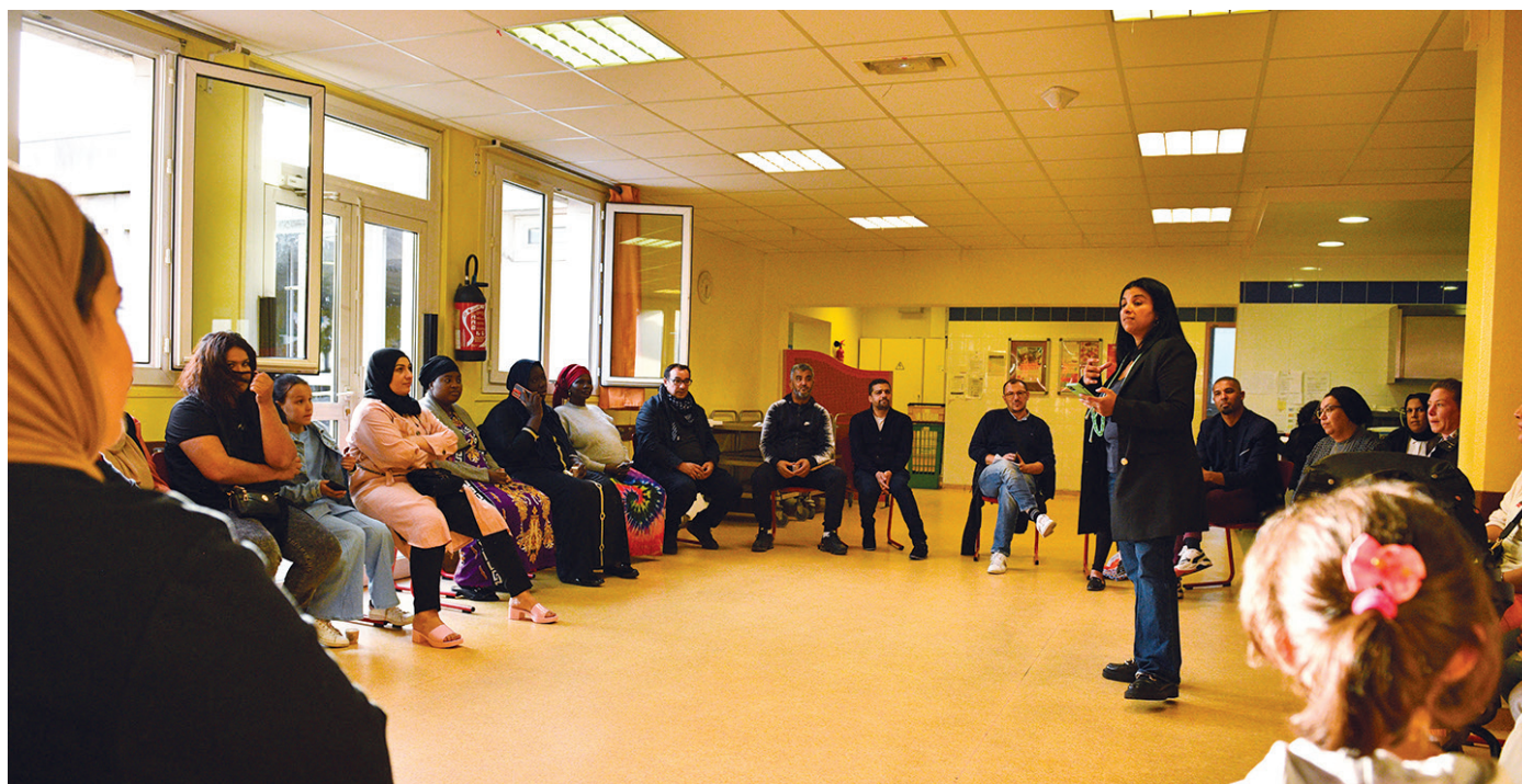
Des échanges intéressants pour le bien-être des écoliers de Victor-Renelle

Les parents du groupe scolaire Victor-Renelle ont repris leur « Café des parents » après une suspension due à la crise Covid. Une originalité et une efficacité qui méritent d'être partagées. Stains actu s'y est fait inviter.