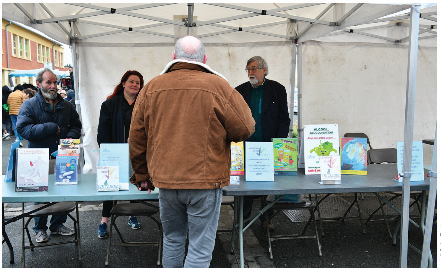
Mercredi, un stand au marché du Centre-ville sensibilisait aux risques de l'alcool. Il sera au même endroit le 11 et 18 janvier

Ce mois de janvier marque le coup d'envoi du Défi Stanois : un événement d'échanges, de réflexions et d'informations autour de la consommation d'alcool et de ses excès.