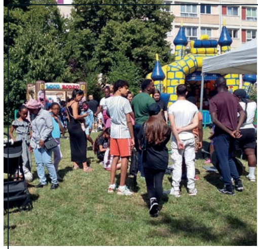
Une série de fêtes a lieu dans les différents quartiers de la ville.

Les trois Maisons pour tous que compte la ville ont toutes leur comité. Les représentants des habitants ont été tirés au sort lors de joyeuses festivités.