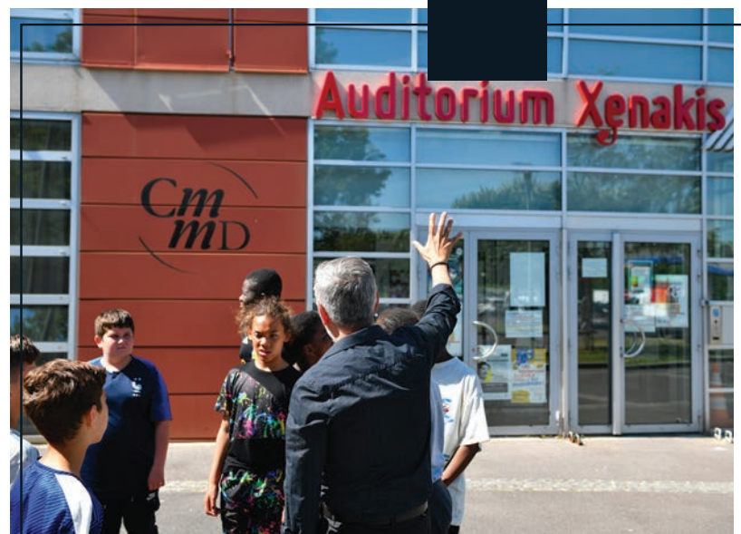
Le bel âge L'auditorium Xenakis fête ses 20 ans.

La Régie de quartier de Stains (Les Rayons) a présenté mardi 21 juin devant ses partenaires et un parterre d'élus du territoire, sa filière de valorisation des cagettes en bois, unique en son genre.