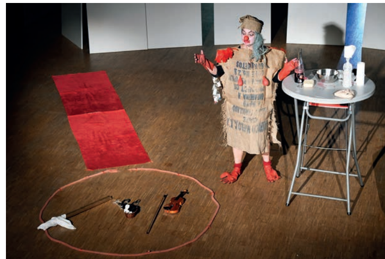
Théâtre de clown Auguste à la Maison du temps libre autour des addictions.

En dehors du « Défi Stanois », des actions de sensibilisation sont menées régulièrement auprès de tout type de public par les services municipaux. Depuis cette année, les classes de CM2 des écoles de la ville sont également concernées avant un grand forum organisé en juin à Jean-Jaurès.