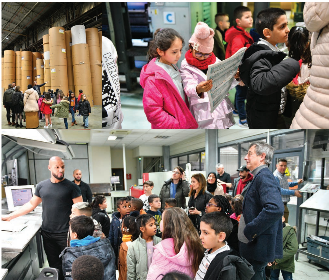
Les jeunes Stanois à la découverte des métiers de l'imprimerie.