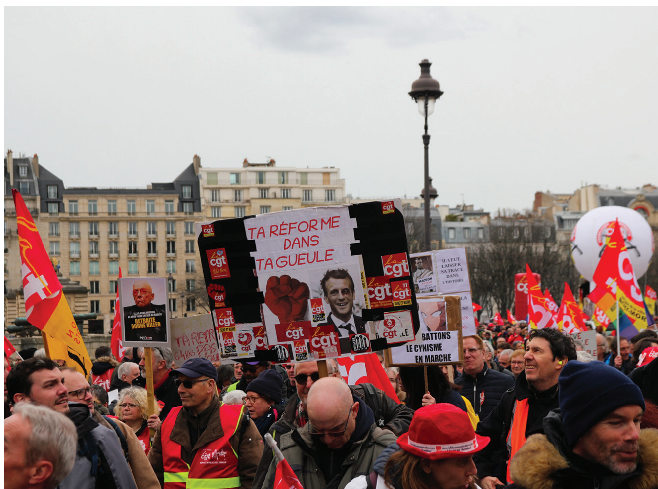
Forte mobilisation, mercredi 15 mars lors de la manifestation à Paris.

Deux mois de mobilisations massives n'auront suffi à faire plier un gouvernement intransigent et un Président aux abonnés absents. Alors que les travaux parlementaires touchent à leur fin, quelle suite donner à la contestation ?