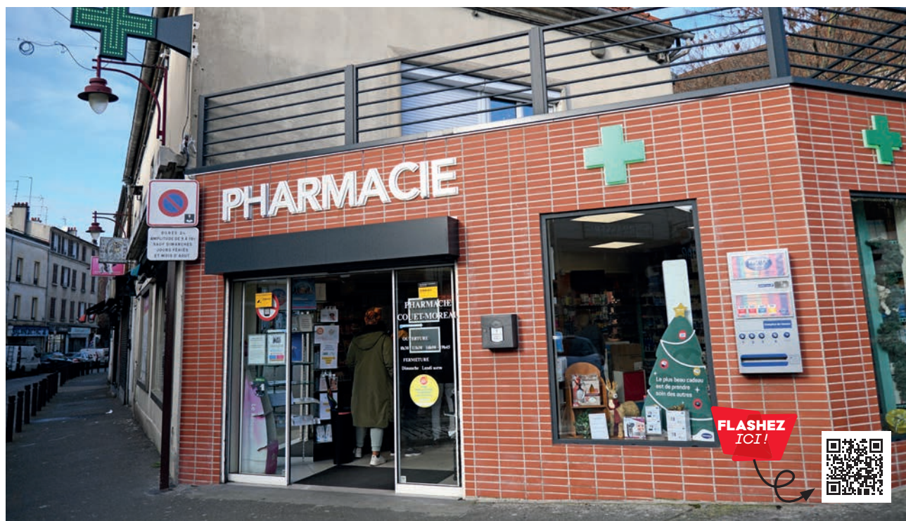
Le nombre de pharmacies d'une ville dépend de sa quantité d'habitants.

Stains compte officiellement 40 443 habitants. Ces chiffres fournis par l'Insee sont primordiaux pour ajuster l'action publique. Cet institut réalisera d'ailleurs le recensement 2024 du 18 janvier au 24 février. Organisé chaque année sur une partie de la ville, il est utile pour la collectivité, confidentiel et aussi obligatoire.