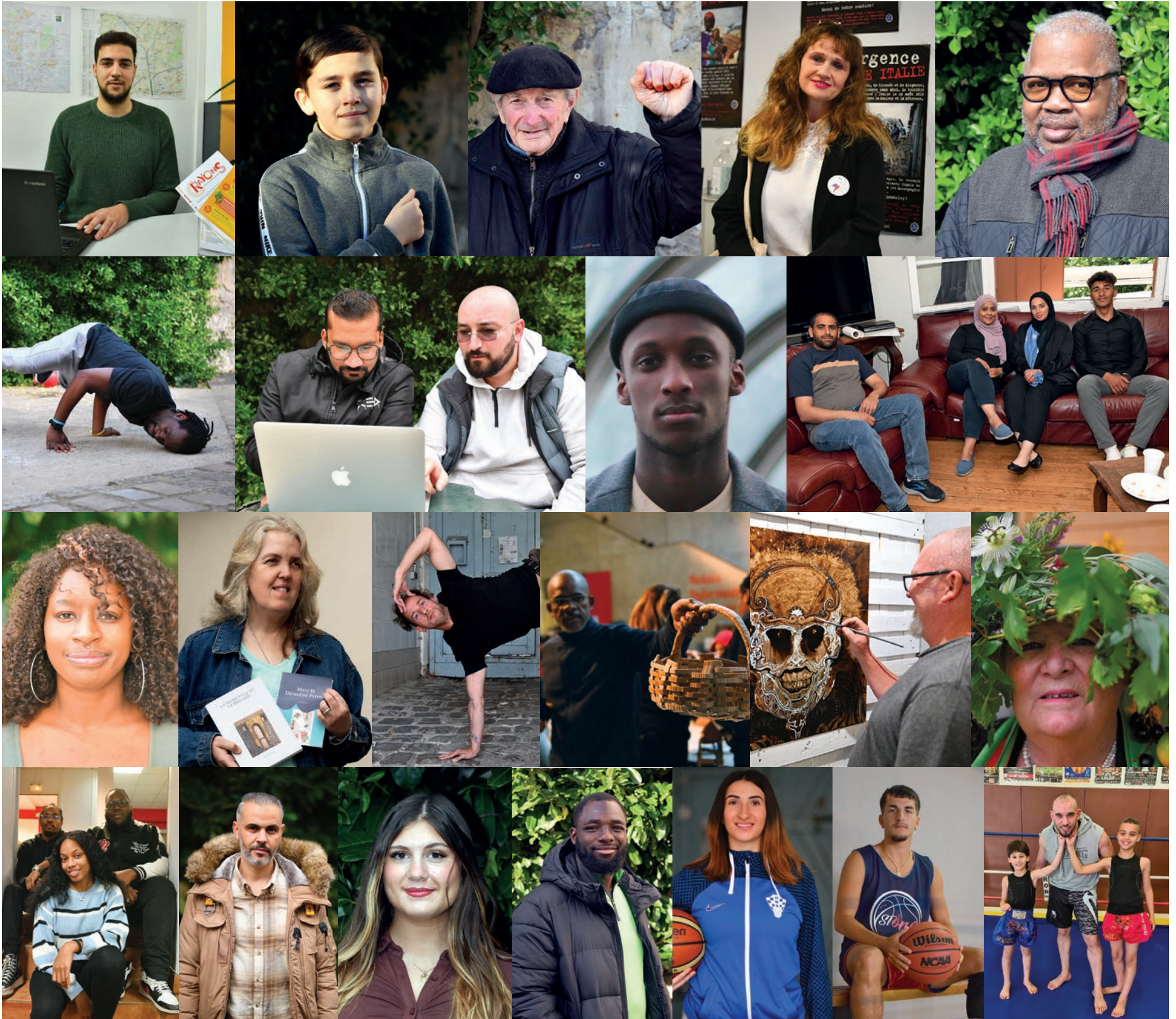
Les 19 portraits 2023 dans l'ordre de parution de gauche à droite de haut en bas.