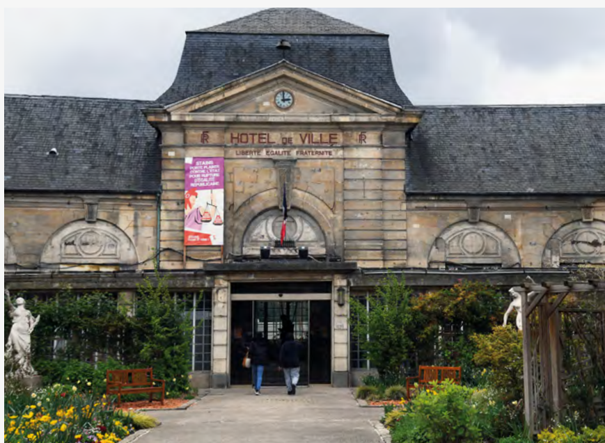
LA RÉNOVATION DE L'HÔTEL DE VILLE EST ELLE AUSSI PRÉVUE DANS LES INVESTISSEMENTS 2024.

« L'épicerie sociale et solidaire ouvrira avant la fin de l'année »,