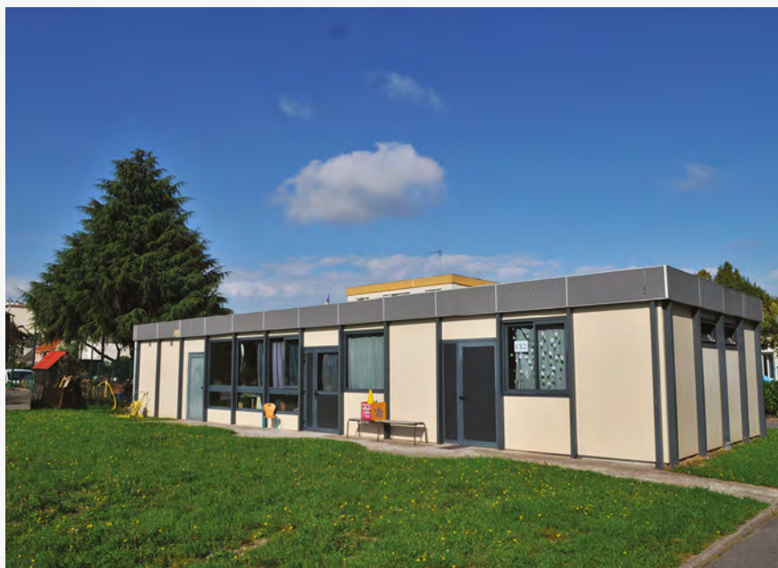
APRÈS DES TRAVAUX À L'ÉTÉ 2023, L'ÉCOLE VICTOR-RENELLE DEVRAIT OBTENIR UNE EXTENSION, UN DES GROS INVESTISSEMENTS DU BUDGET 2024.

21 876 990,07 € d'investissements prévus pour 2024