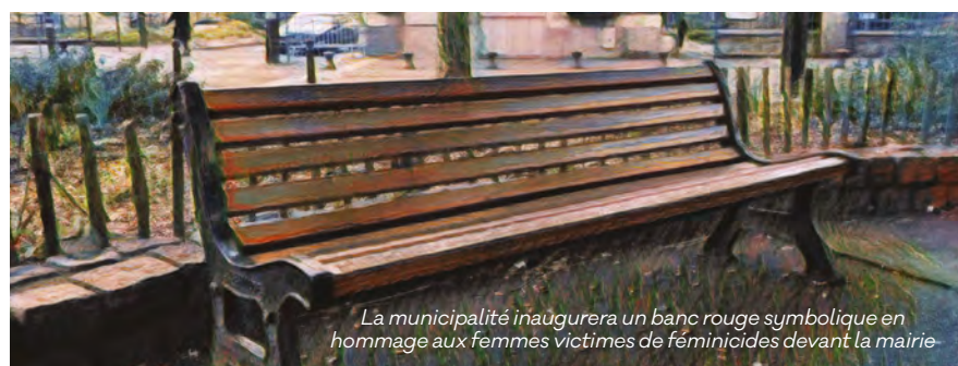
La municipalité inaugurerait un banc rouge symbolique en hommage aux femmes victimes de féminicides devant la mairie

Dans quelques jours débutera la 5 e édition du Mois de l'égalité. À Stains, c'est en mars que plusieurs rendez-vous et événements appellent les Stanois au rassemblement sur les thématiques de l'égalité femmes-hommes, les discriminations et le handicap. À vos agendas.