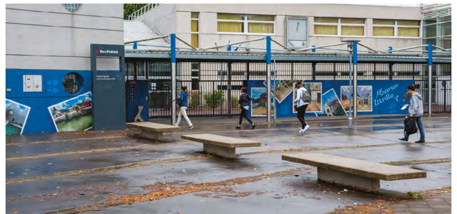
Dès lundi, une grève s'annonce au lycée

Afin d'obtenir plus de moyens à l'échelle départementale et un plan d'urgence pour le 93, les enseignants du lycée vont se mobiliser à la rentrée à l'appel des syndicats.