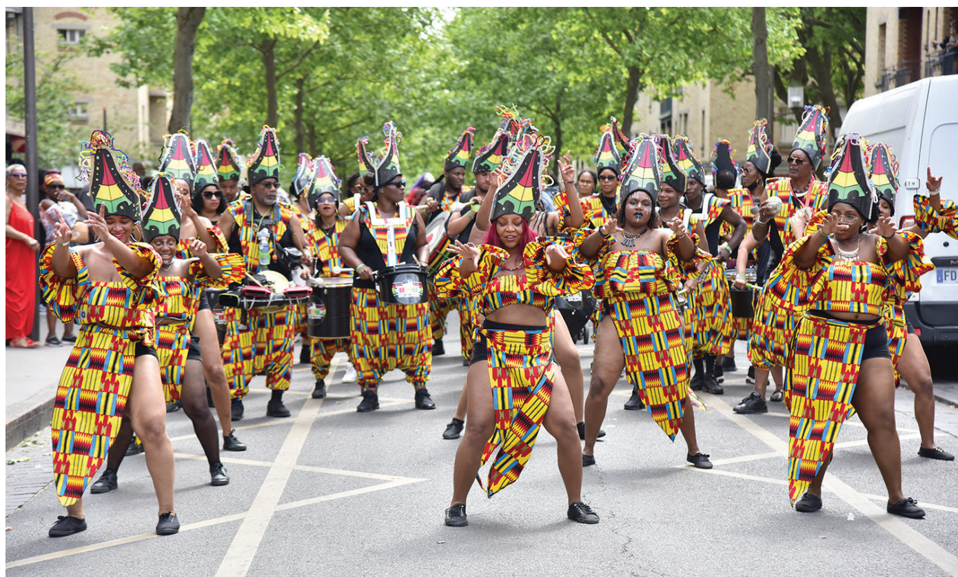
Une ambiance chaleureuse et colorée va envahir les rues stanoises.

D imanche 19 mai, plus de 600 musiciens et danseurs défilent dans les rues de la ville sous la houlette de l'association Action créole pour la cinquième édition du Carnav' Stains.