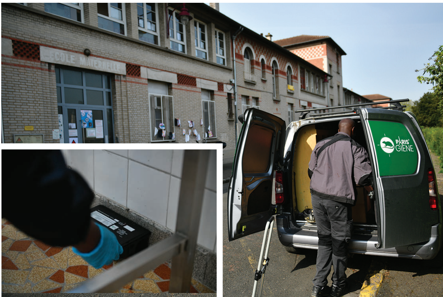
Le groupe scolaire Jean-Jaurès est l'un des bâtiments communaux traités en prévention.