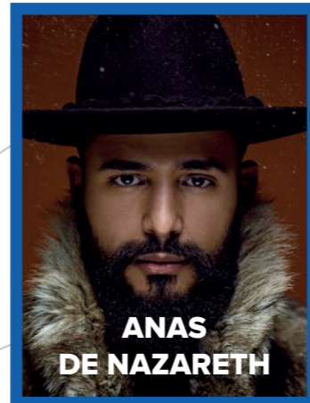
ANAS DE NAZARETH