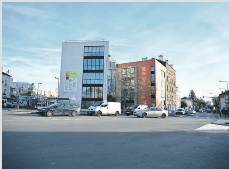
La commune de Stains cède au Conseil départemental de la Seine-Saint-Denis le bâtiment à usage de bureaux (1 et 5 boulevard Maxime Gorki) afin d'y implanter une Maison des Solidarités.

Jeudi 21 novembre s'est tenu le Conseil municipal en mairie et en direct sur le site internet de la ville.