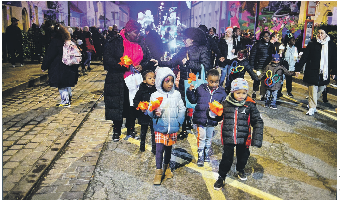
Comme chaque fin d'année, les fêtes solidaires vont égayer la vie stanoise

Les jours raccourcissent, les décorations de lumière s'installent et les Fêtes solidaires approchent. Fin décembre, ce moment festif est de retour avec son lot d'activités pour petits et grands.