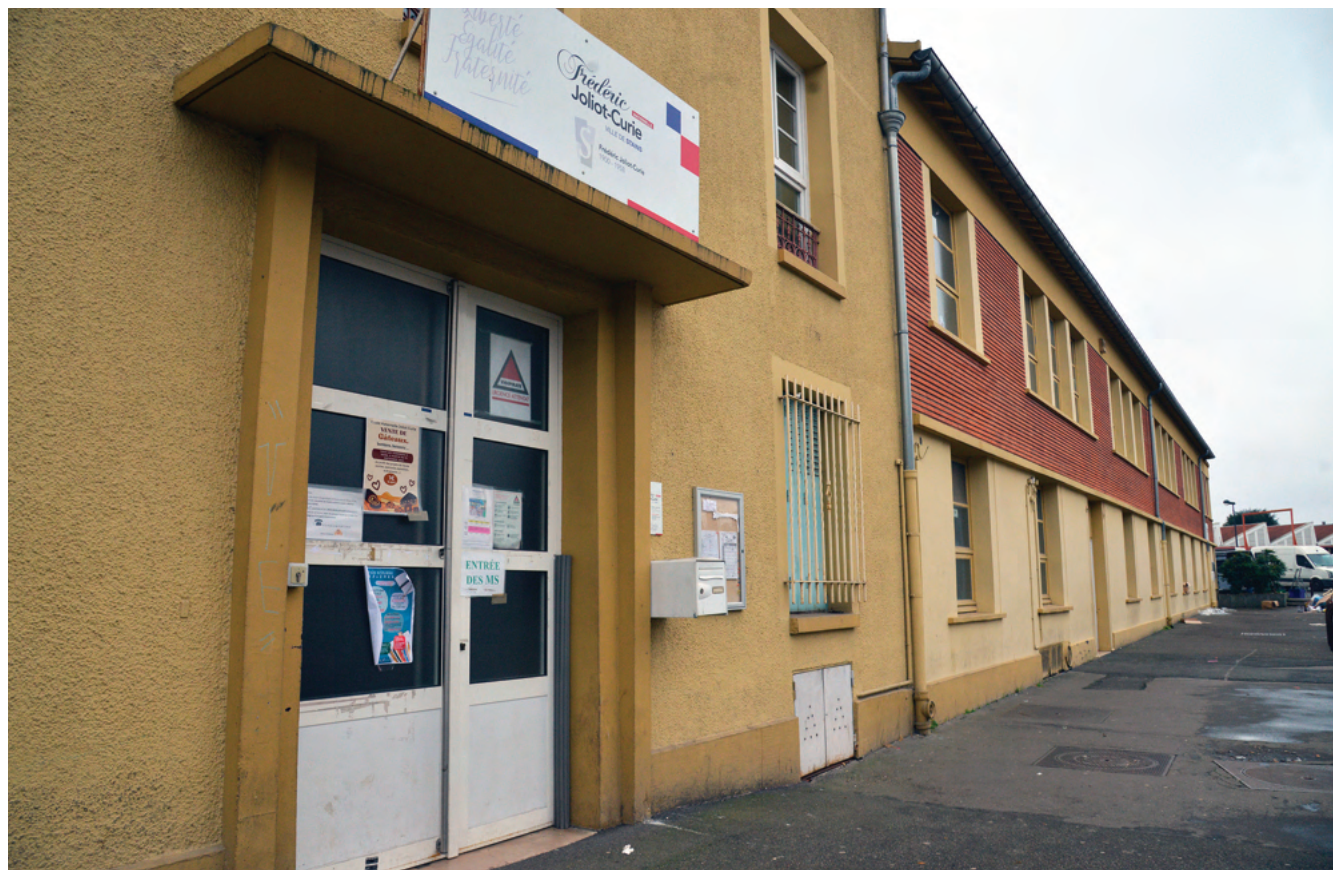
En 2025, il est prévu d'investir 3,6 millions d'euros sur le bâti scolaire. Les écoles Joliot-Curie et Guillaume-Apollinaire devraient en bénéficier.