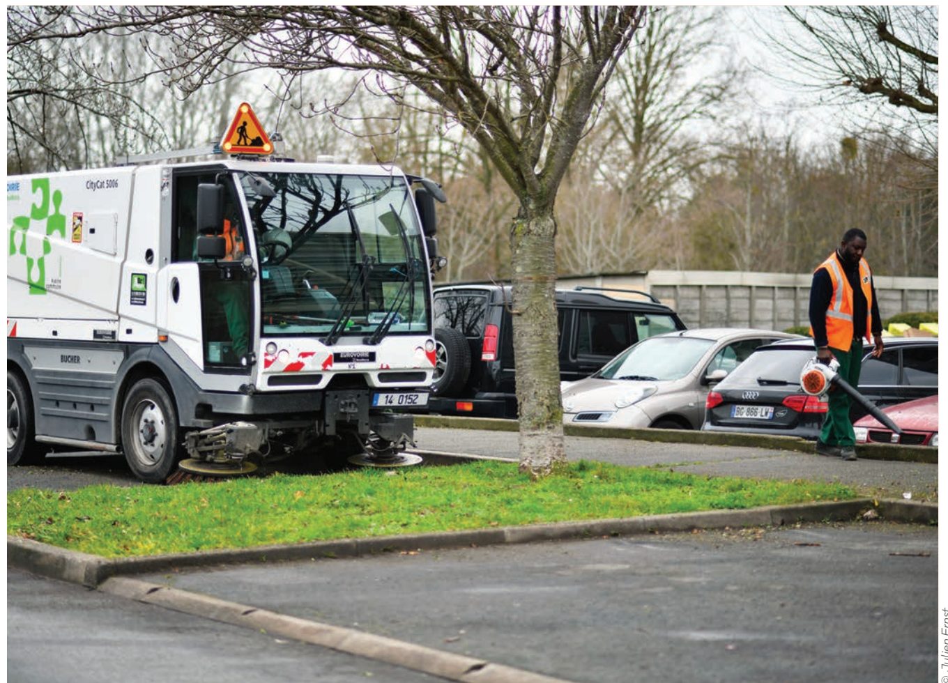
Les Coups de propre auront lieu dorénavant une fois par semaine. Soyez vigilants!

Judi 20 mars, les Coups de propre reprennent du service, mais de manière hebdomadaire. Stains actu informera des dates et des rues concernées au fil des semaines et vous explique tout.