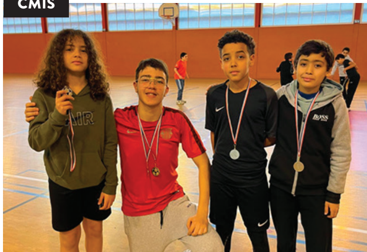
Les tournois de football et basket organisés par le Centre municipal d'initiation sportive (CMIS) ont permis à une centaine d'enfants de s'affronter lors de joutes sportives. Certains étaient fiers d'afficher leurs médailles.