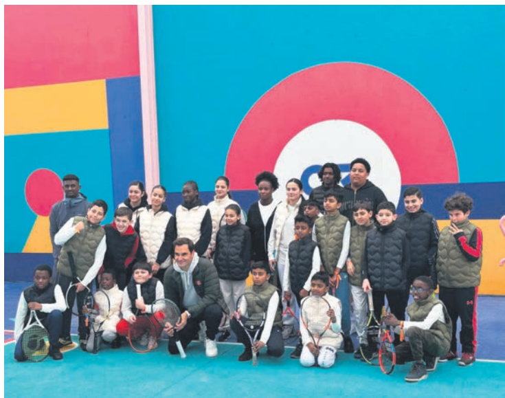
Les jeunes de Fête le mur entourent le champion Roger Federer.