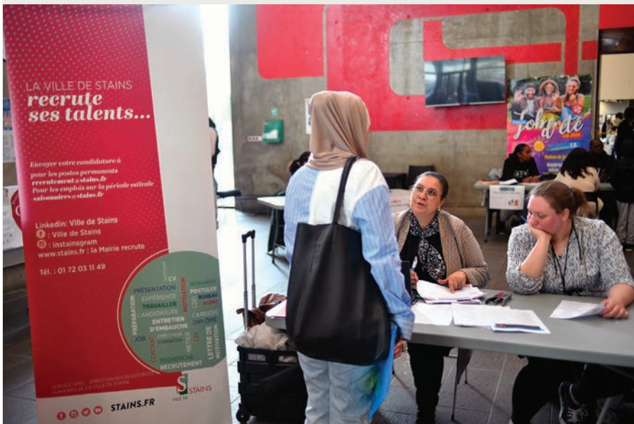
Des représentants des services municipaux accueilleront les jeunes pendant le forum.

Mercredi 19 mars aura lieu le Forum job d'été de 13h 30 à 18h à la Maison du temps libre. De nombreuses offres d'emploi saisonnier y seront proposées.