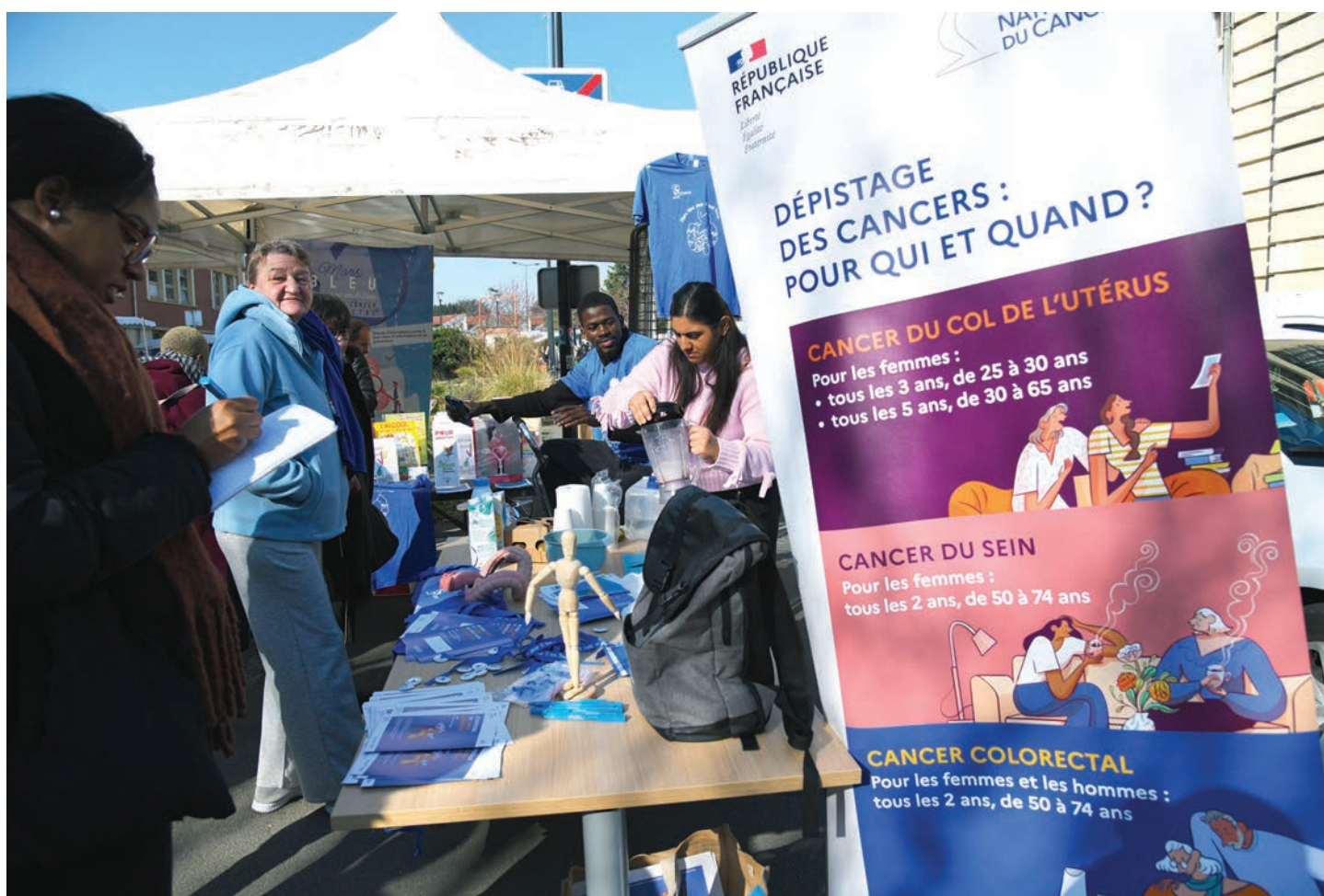
Un message à méditer en pédalant sur le vélo à smoothies - sur le marché du centre - pour tous ceux qui songent fortement à remettre leur santé en selle...

Balade « Blue day » à partir de 13h30 au départ du Local du patrimoine de la Cité-Jardins pour découvrir comment la construction de la cité fut liée à la question du bien-être des habitants. Une balade accompagnée par des professionnels de l'association Addictions alcool vie-libre.