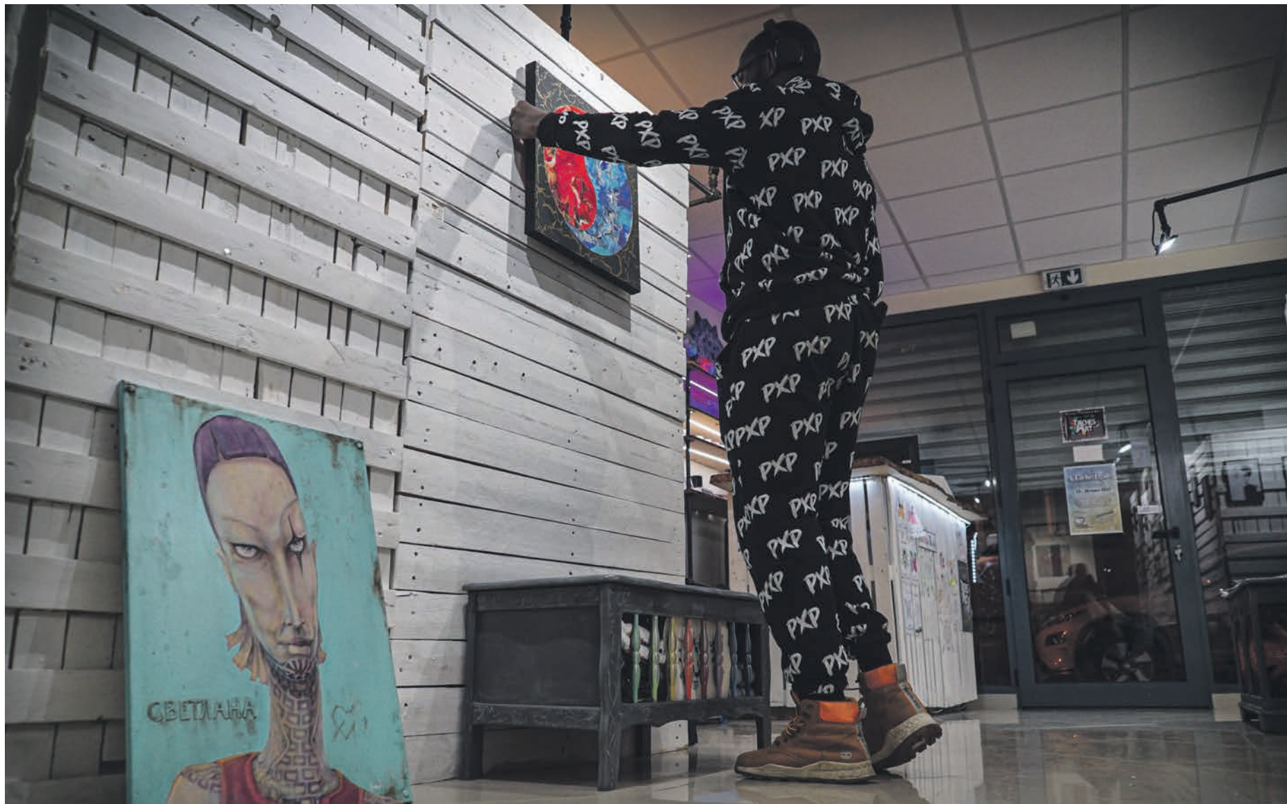
Derrière le rideau de fer de la galerie, l'exposition se prépare.